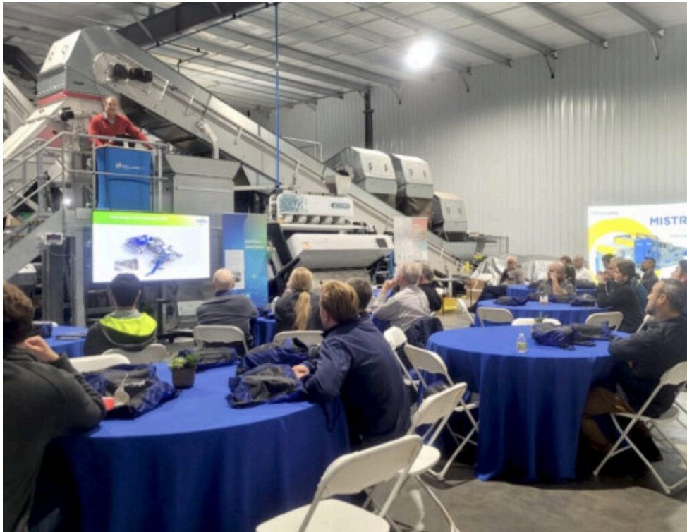
L'inauguration du nouveau centre de tests.

pays. « L'inauguration du centre de tests américain sera rapidement suivie par le déménagement et la modernisation de notre centre de tests japonais et par l'ouverture de nouveaux centres de tests en Australie et au Royaume-Uni d'ici 2024 », révèle Jean Henin , président de Pellenc ST.