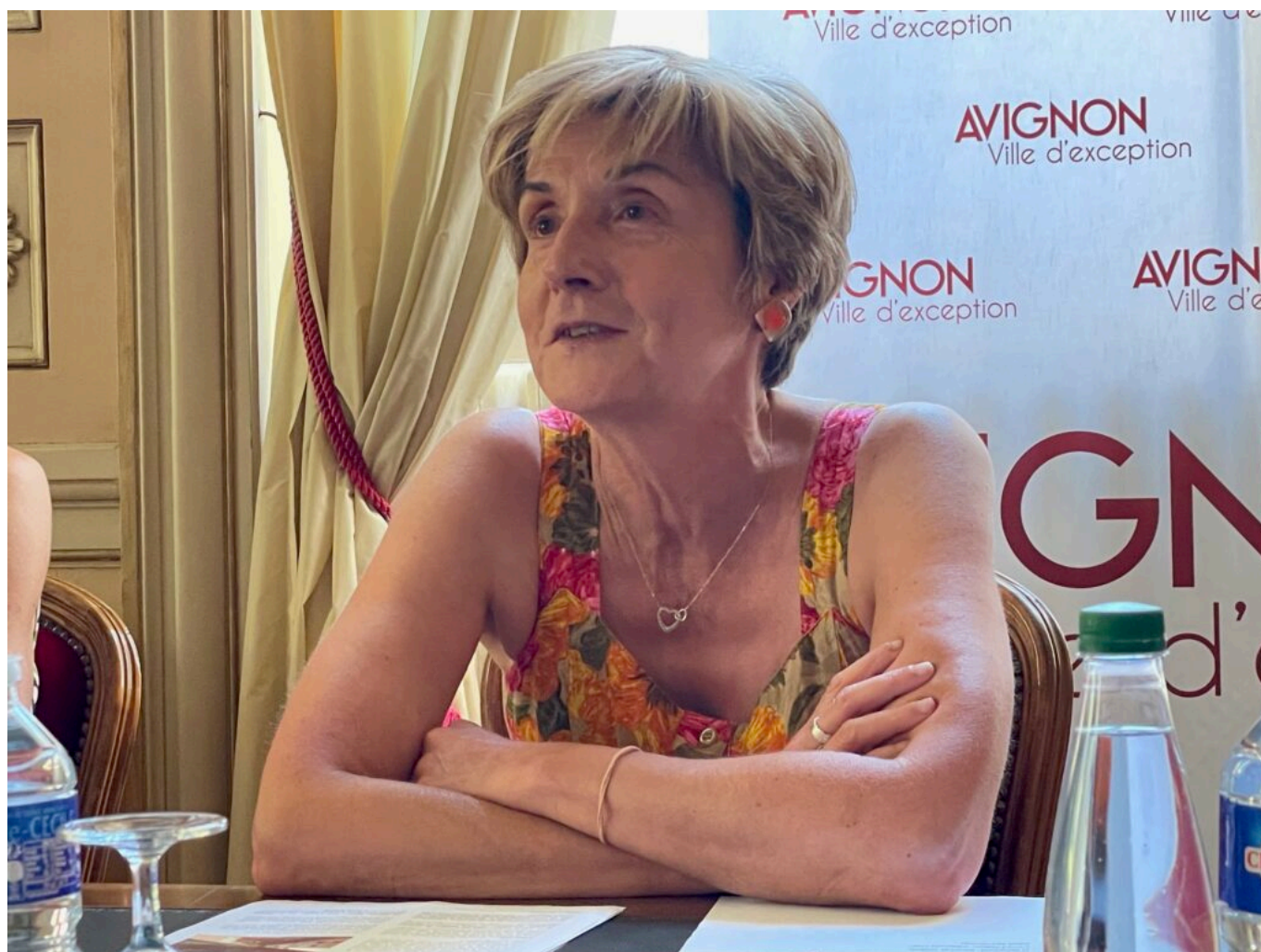
Cécile Helle, maire d'Avignon