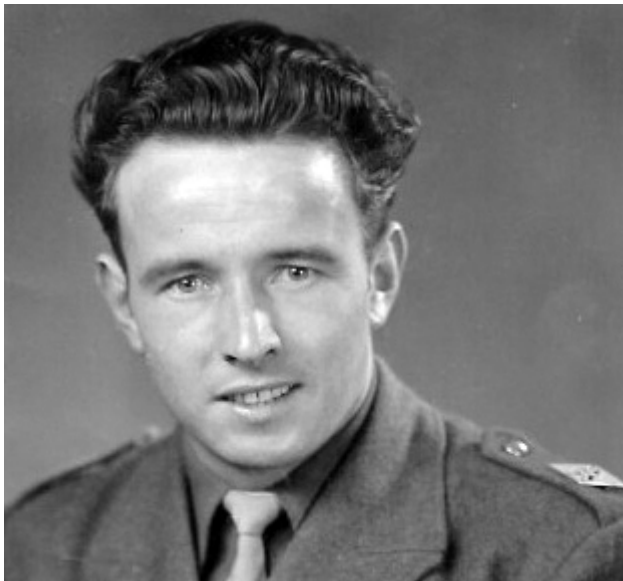
Louis Le Saint ©DR