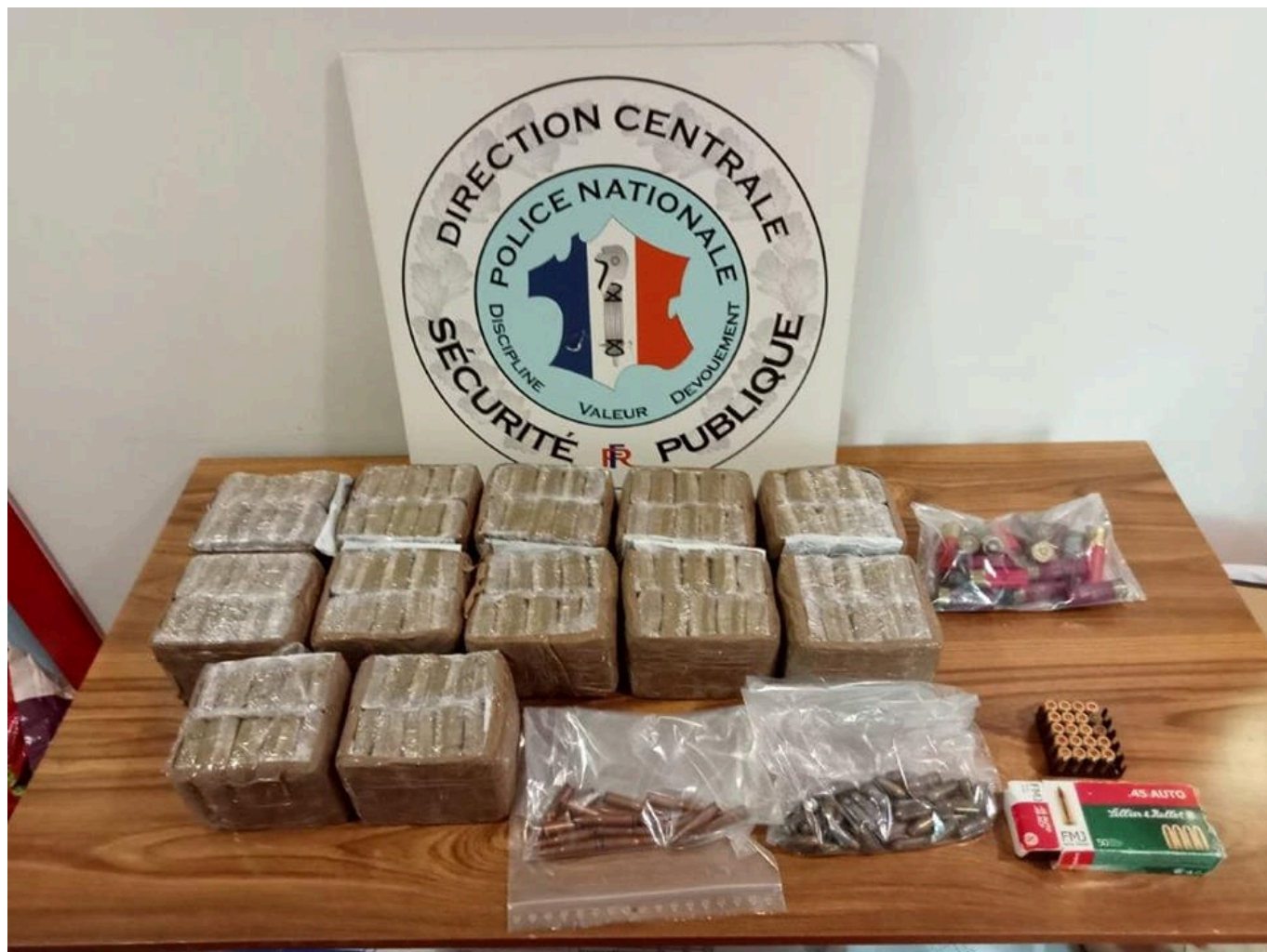
Détails des saisies menées par la brigade des stupéfiants de Vaucluse dans la cité Louis-Gros à Avignon.

Par ailleurs, quasiment dans le même temps, les policiers du département a procédé à une autre intervention dans la cité des papes. Dans le contexte de règlements de compte sur Avignon ces derniers mois, la brigade des stupéfiants de la Sûreté Départementale surveillait ainsi depuis plusieurs semaines le quartier Louis-Gros pouvant servir de base arrière pour le stockage de stupéfiants et d'armes.