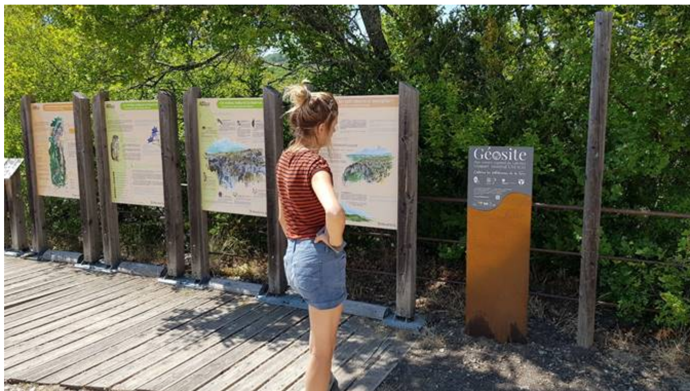
Les gorges d'Oppedette, géosite du Luberon