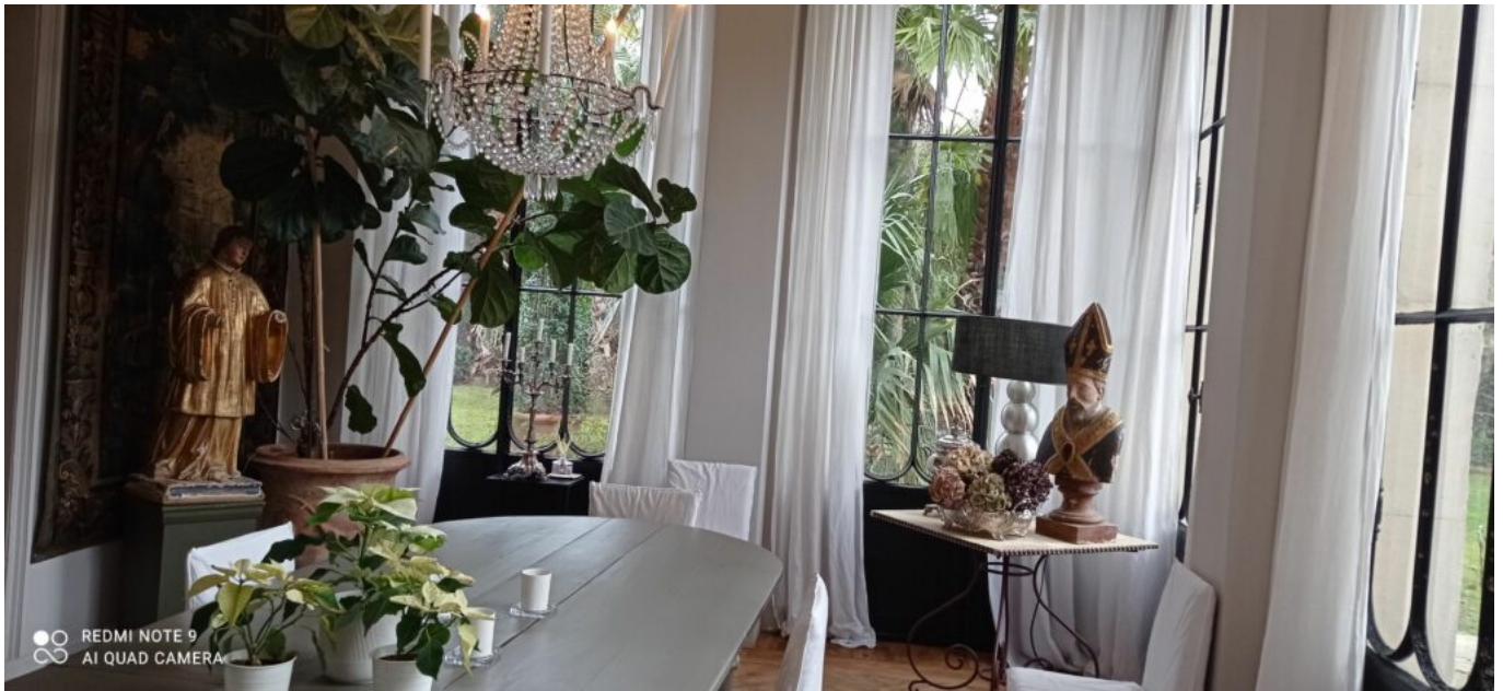
La Divine Comédie.

La Divine Comédie propose un voyage dans le temps et l'espace avec cinq suites qui allient confort et élégance. Le jardin attenant est un véritable écrin de verdure avec plus de 100 essences différentes et bambous géants. Le bassin de nage de 15 mètres de long, le jacuzzi et le spa complètent une offre de détente à l'abri des regards, mais avec une magnifique vue sur le Palais des Papes.