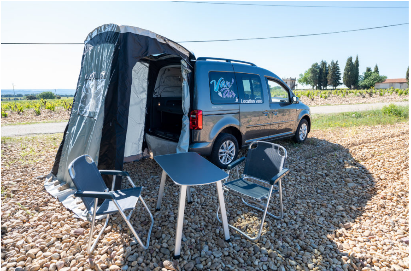
Le Caddy Beach avec une tente de hayon.