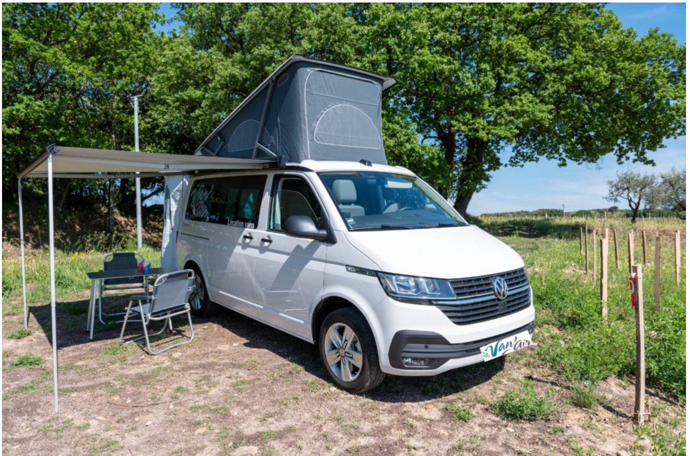
Le 'California' avec le toit relevable.