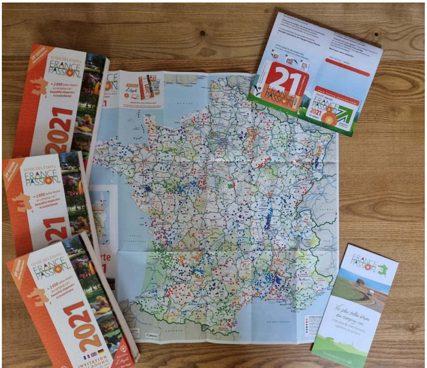
Les livrets France Passion.

bon voyageur, permet de dormir gratuitement chez les agriculteurs locaux se trouvant sur son parcours. Plus de 200 adresses sont répertoriées, dans des lieux d'accueil aussi authentiques qu'atypiques. En 1997, suite à un accord avec les Chambres d'agriculture et 'Bienvenue à la ferme', des producteurs de fromages, de miel, de fruits, ont rejoint le réseau aux côtés des vignerons. A noter, la consommation et tout achat au sein d'un établissement est à la charge du client. L'entrepreneuse a ainsi découvert foultitude d'endroits magiques lors de ses balades ainsi que des produits du terroir méconnus, qu'elle souhaite faire découvrir à sa clientèle.