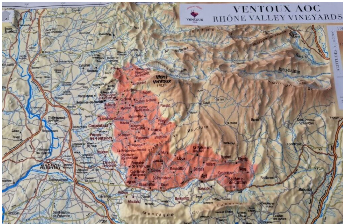
Carte de l'AOC Ventoux.