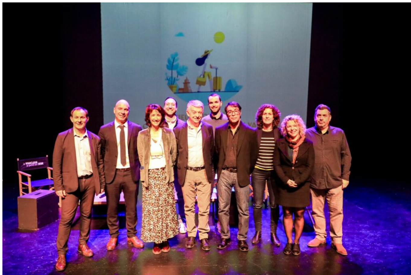
HOGQUEL A - VPA

Le 12 mars dernier, l'agence du développement, du tourisme et des territoires Vaucluse Provence Attractivité a réuni ses partenaires du monde du tourisme à l'Auditorium Jean-Moulin