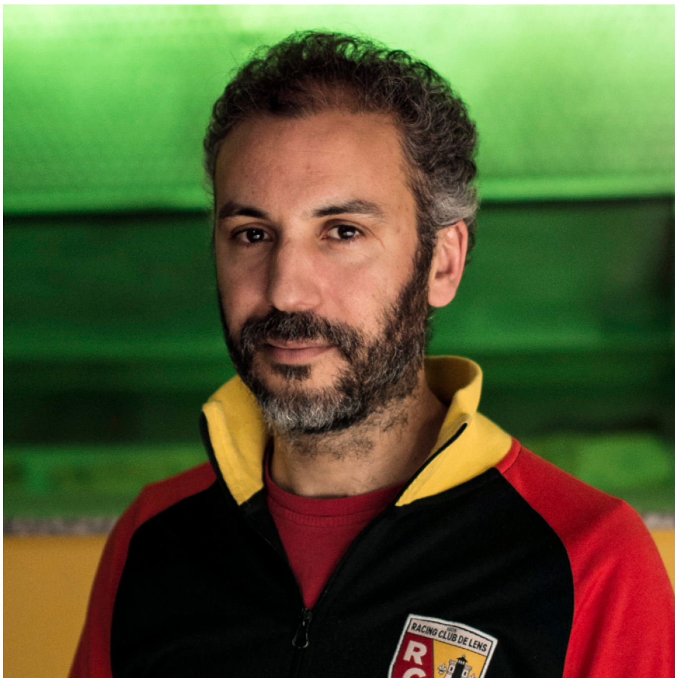
Portrait de Mohamed El Khatib

La soirée unique de clôture de cette 78ième édition sera cette année à l'Opéra Grand Avignon C'est la chanteuse espagnole Silvia Pérez Cruz qui aura l'honneur de distiller à 23h59 les premières