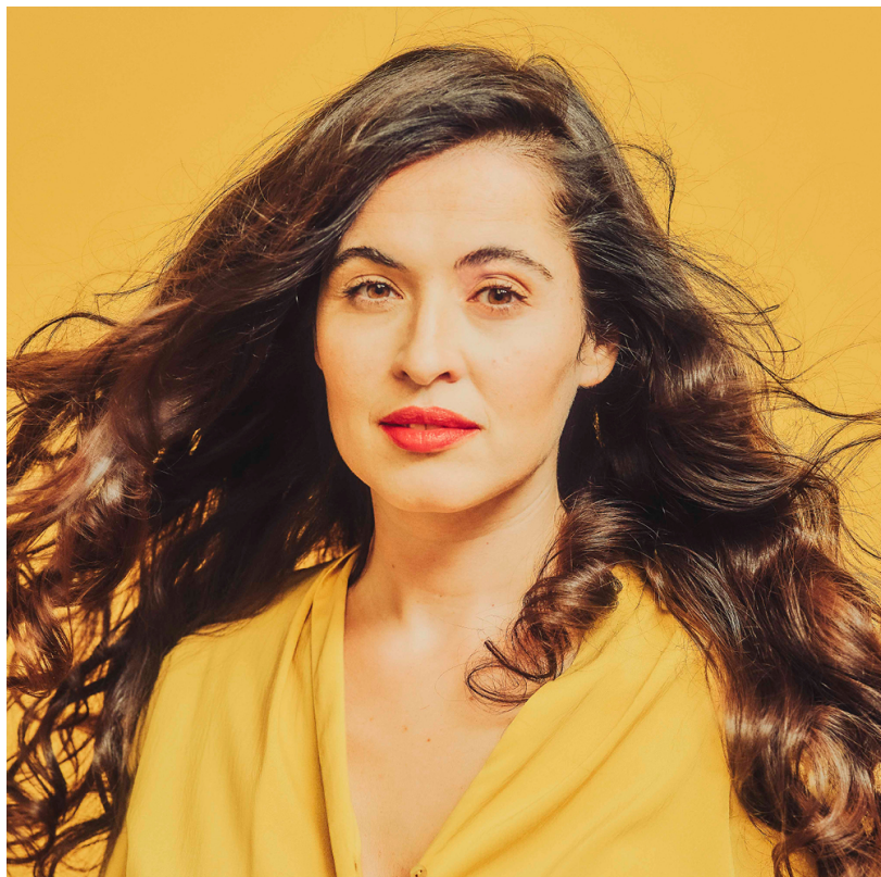
Portrait de Sílvia Pérez Cruz

notes de son récital Toda la vida, un dia. Cette soirée est en partenariat avec Les Sud à Arles. Programme complet notamment pour les Territoires cinématographiques d'Utopia, les Fictions de France Culture, les expositions, les lectures, les débats etc....sur le site du Festival.