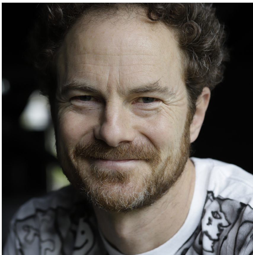
Portrait de Boris Charmatz