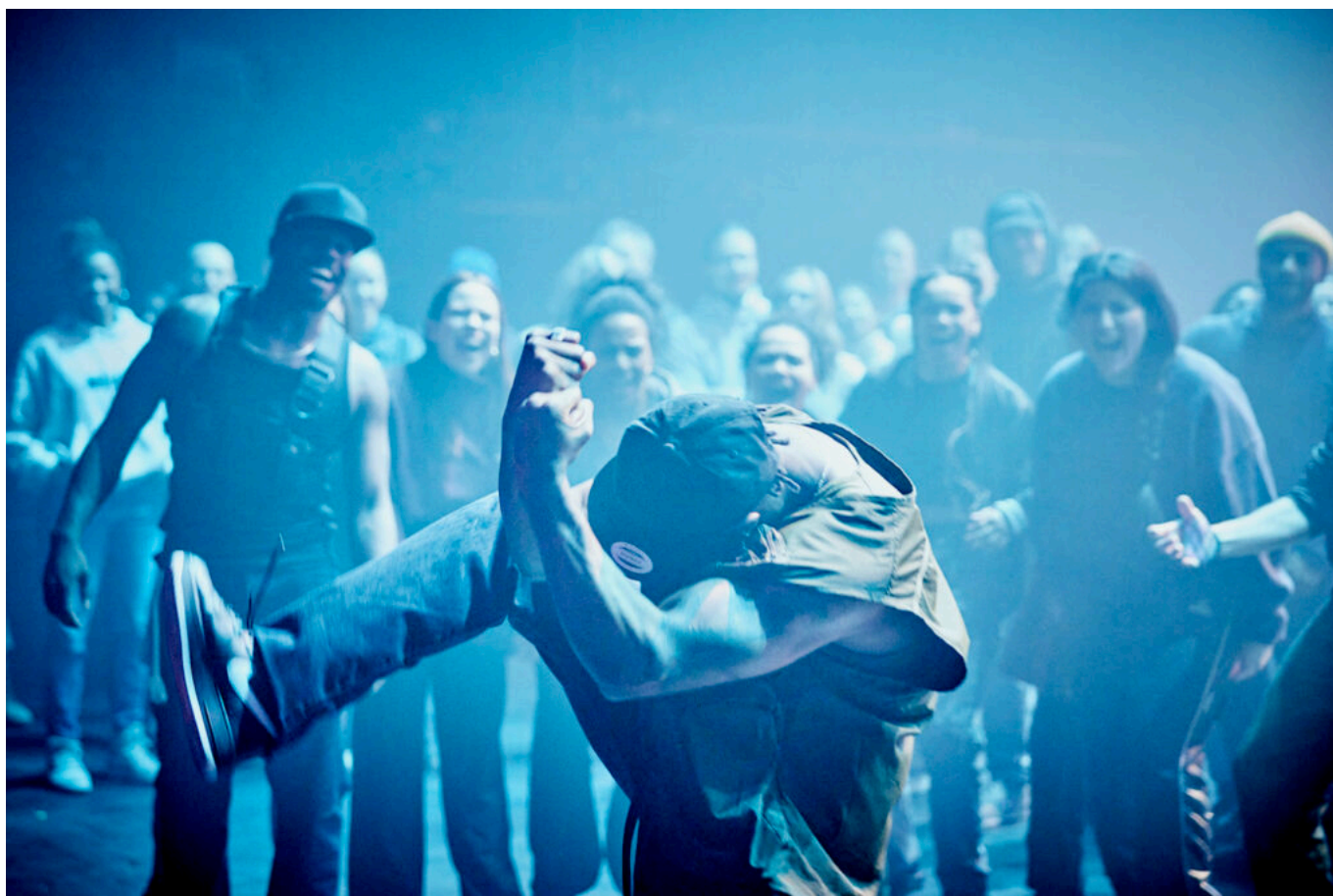
Groove spectacle d'ouverture