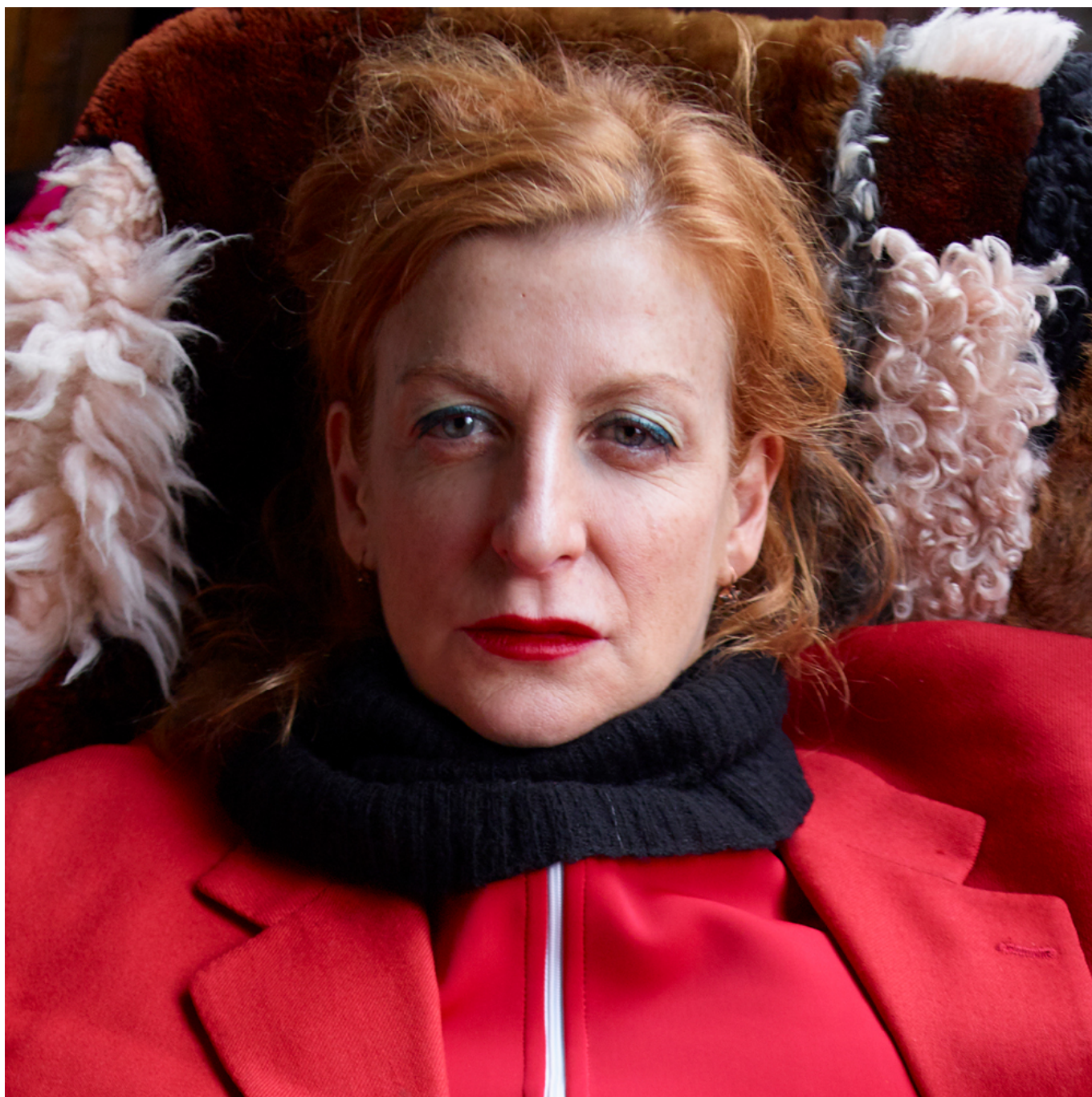
Portrait de La Ribot