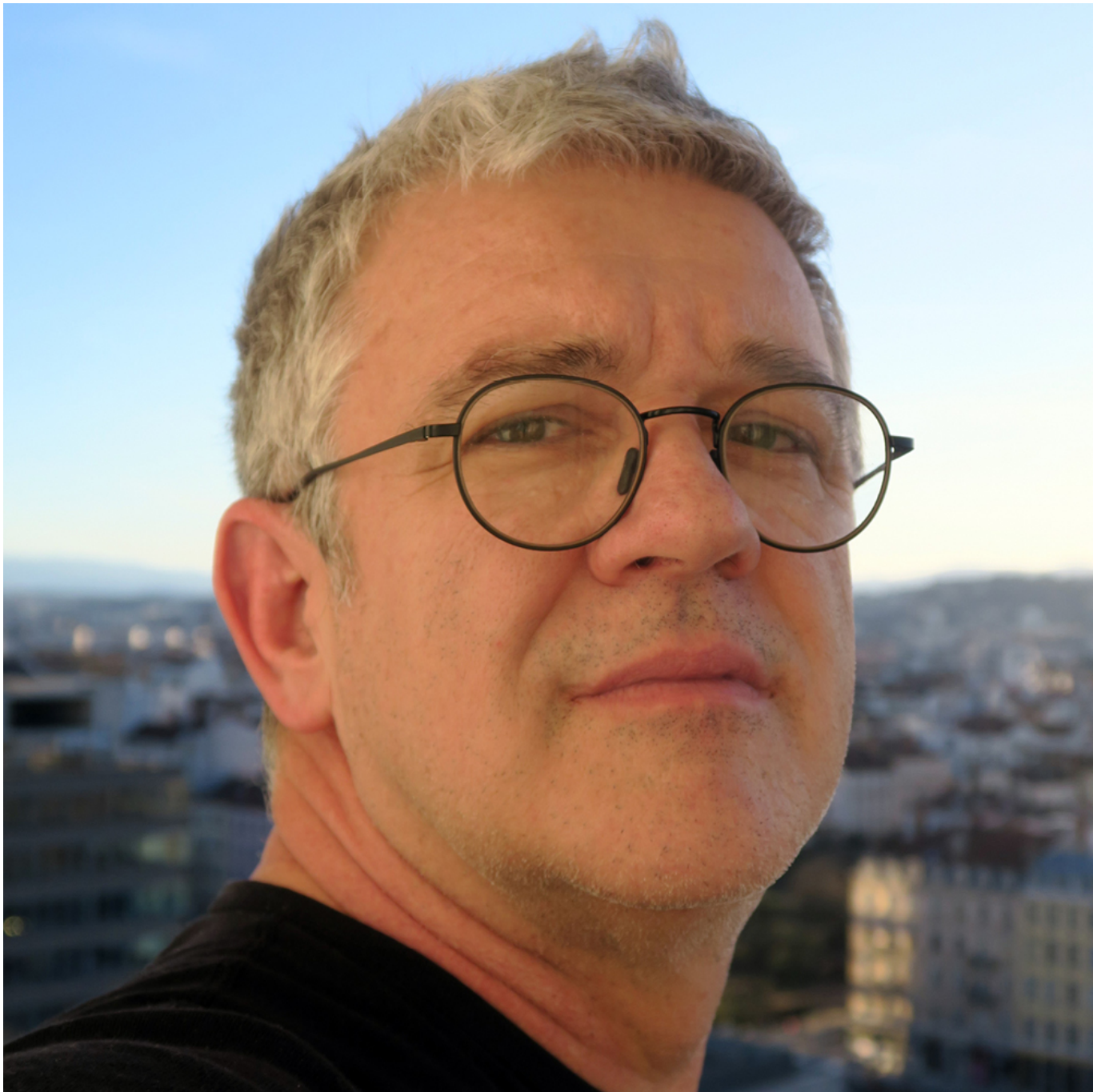
Portrait de Gwenaël Morin © Gwenaël Morin