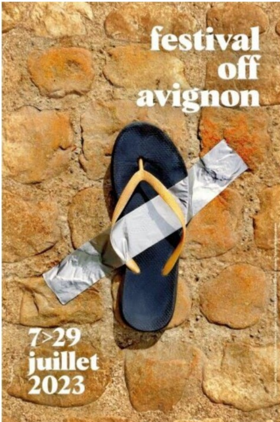
L'affiche du Festival Off