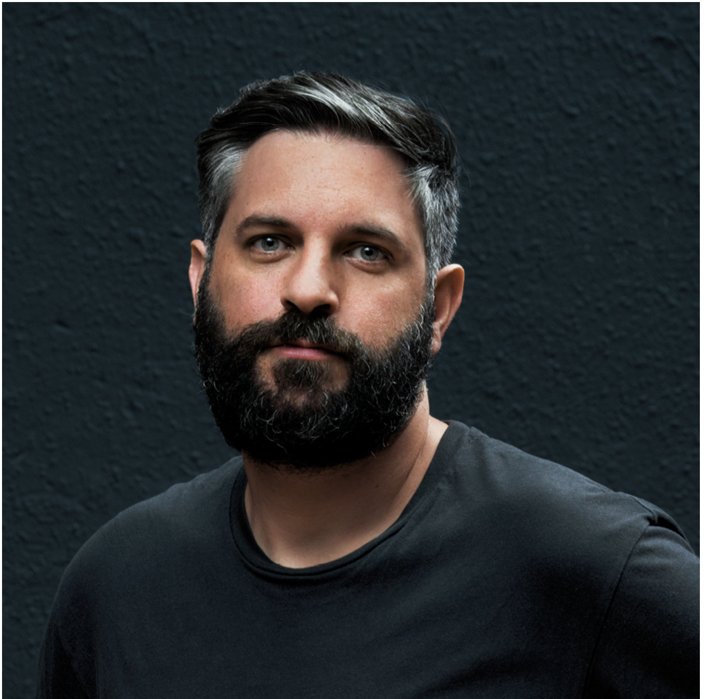
Portrait de Gabriel Calderón