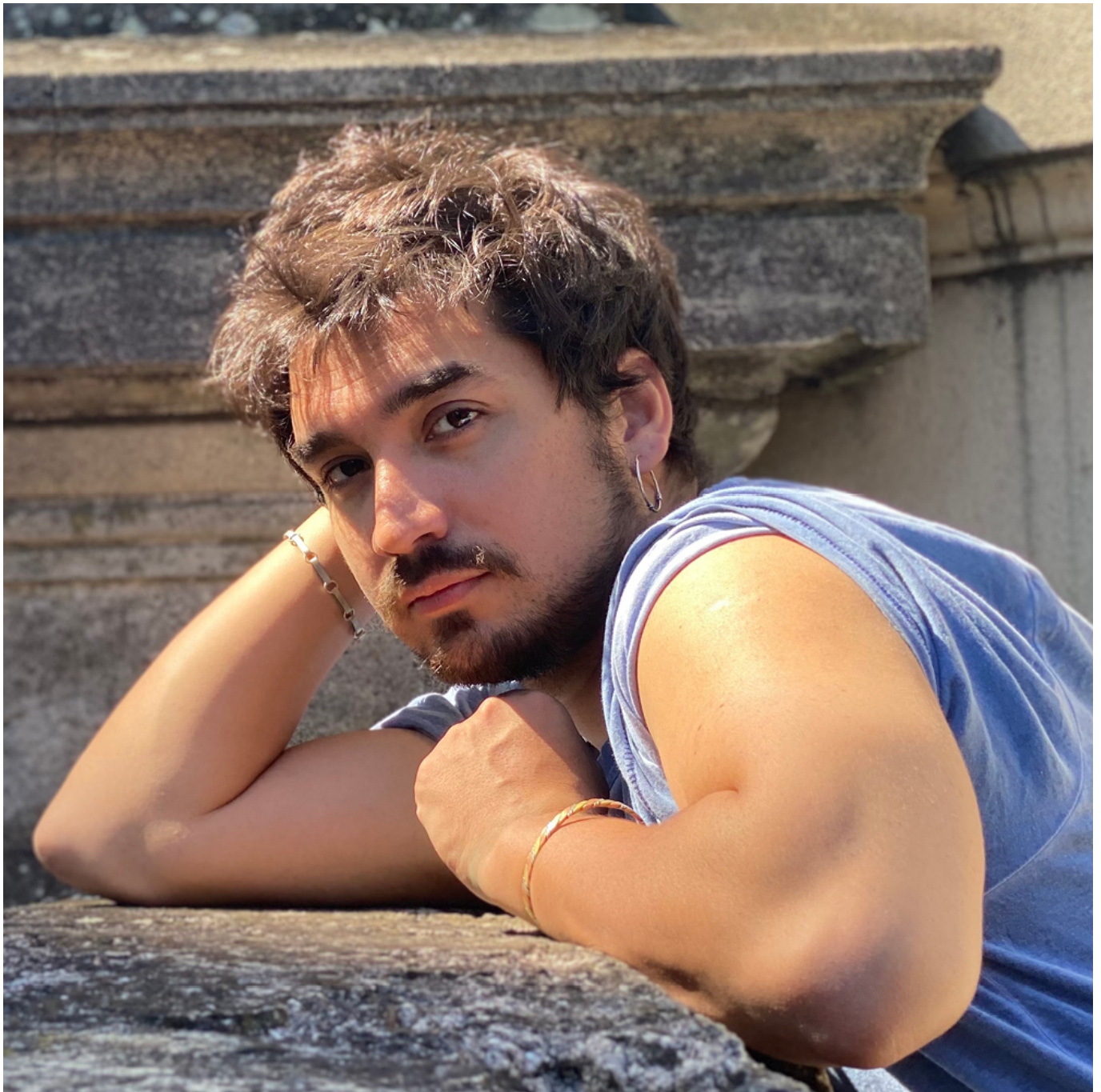
Portrait de Malicho Vaca Valenzuela © Malicho Vaca Valenzuela