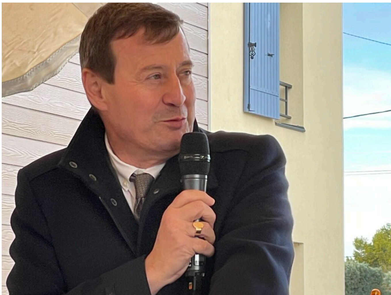
Thierry Suquet, Préfet de Vaucluse