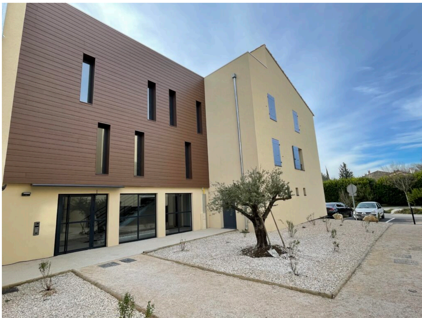
Les Glycines au Thor