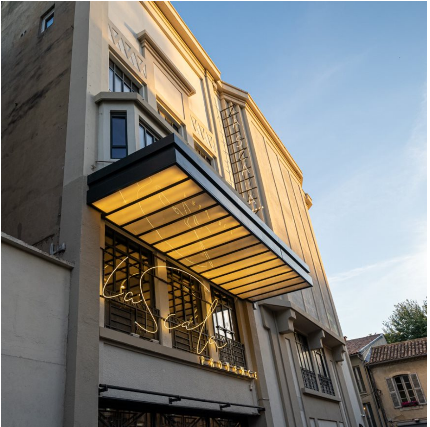
La Scala Provence DR