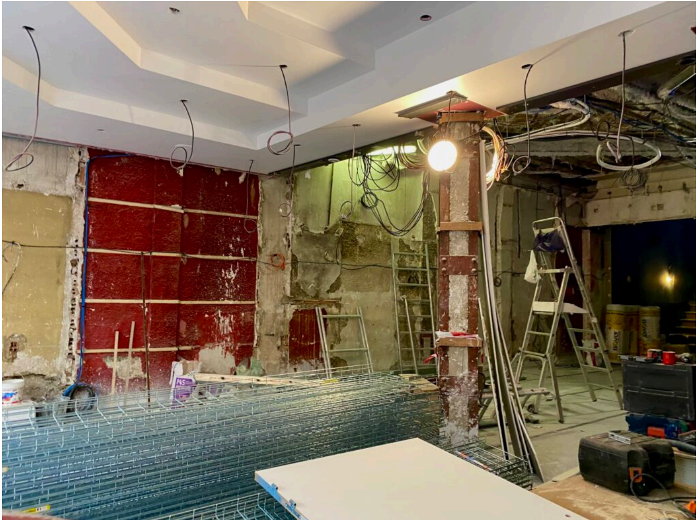
L'entrée de la Scala Provence.

seront repeints de la teinte de bleu éponyme, les fauteuils, également bleus, seront prêts à accueillir les spectateurs, et les quatre salles de spectacle pourront accueillir les artistes.