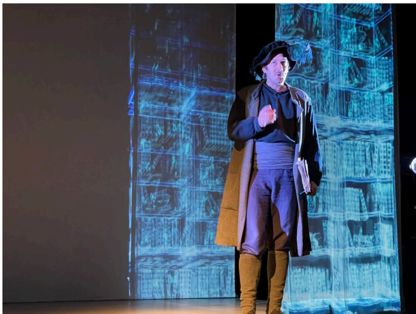
Un conteur 3.0