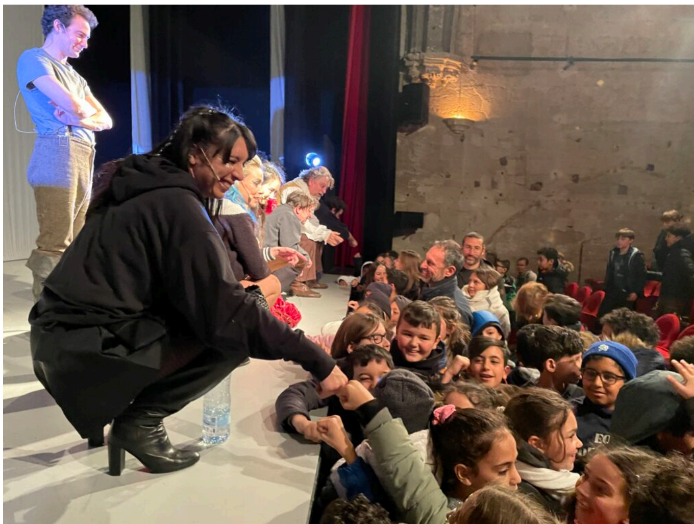
Les enfants, enchantés, félicitent les comédiens