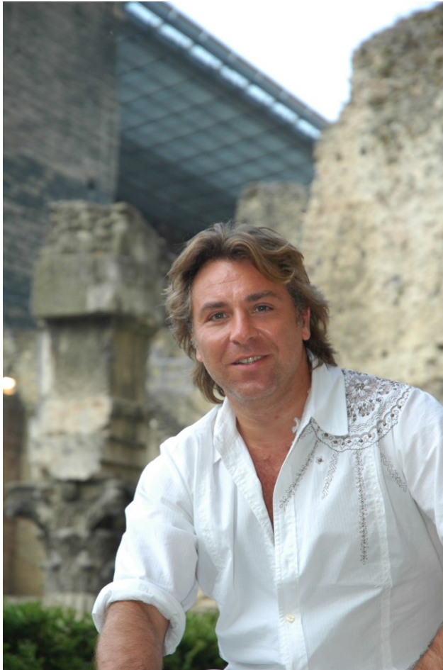
Roberto Alagna devant le théâtre antique d'Orange.