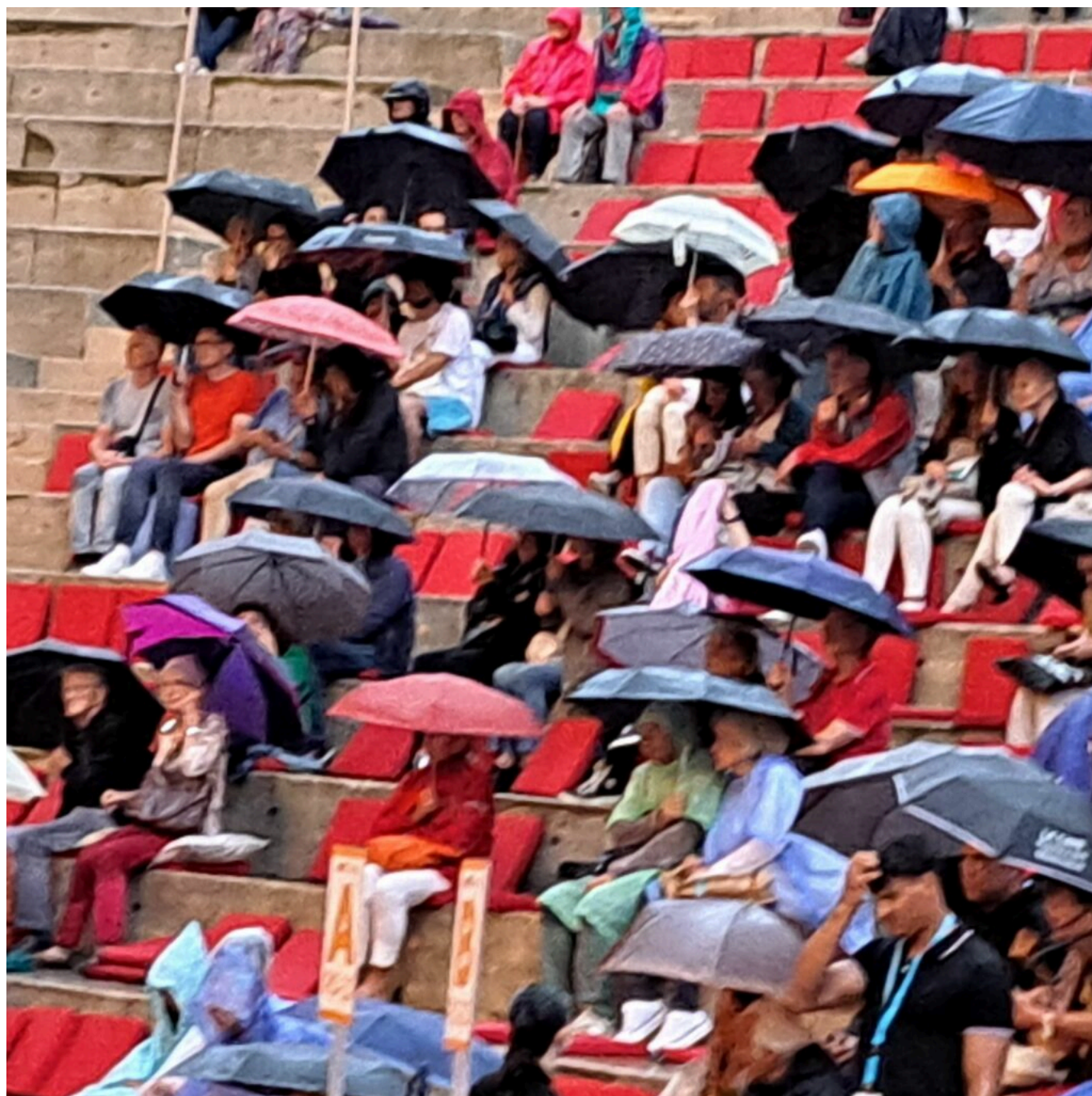
Forêt de parapluies sur les gradins