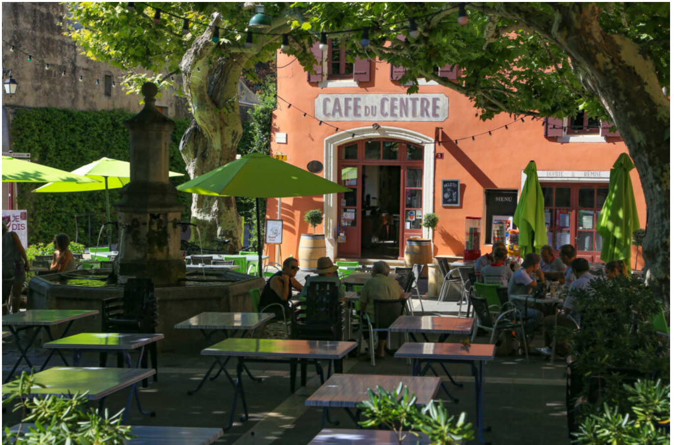
HOCQUEL A - VPA

Emblème de la culture française, il existe autant de manières de vivre un moment en terrasse qu'il existe de personnes. Parce que les terrasses sont omniprésentes au sein du paysage français, l'édition 2023 du sondage Ifop valorise la richesse de nos régions. Si les habitants de la région Nord-Ouest reconnaissent l'intérêt des terrasses ensoleillées du Sud de la France, ils défendent avec fierté les leurs. Ils sont ainsi 60% à estimer que c'est leur région qui se rend le plus en terrasse parmi les autres régions de France, juste derrière le Sud de la France. Le Nord-Ouest est la seule région de l'hexagone à revendiquer les terrasses comme incarnation du patrimoine culturel local, devant le patrimoine régional ou national. Au total, 22% des Français interrogés estiment même que la Bretagne possède les plus belles terrasses de France. Les natifs du Sud-Est et du Sud-Ouest sont ceux qui vantent le plus le mérite de leurs terrasses : 82% d'entre eux estiment qu'elles les rendent fiers de leur région, contre 77% en moyenne.