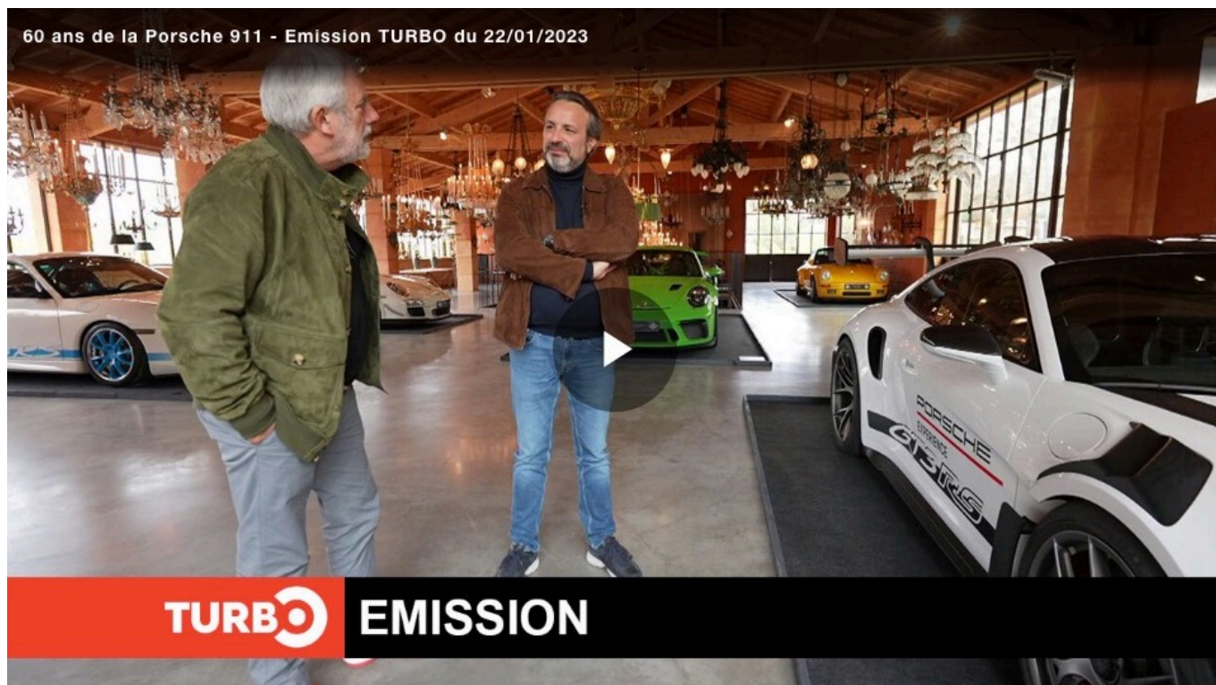
60 ans de la Porsche 911 - Emission TURBO du 22/01/2023