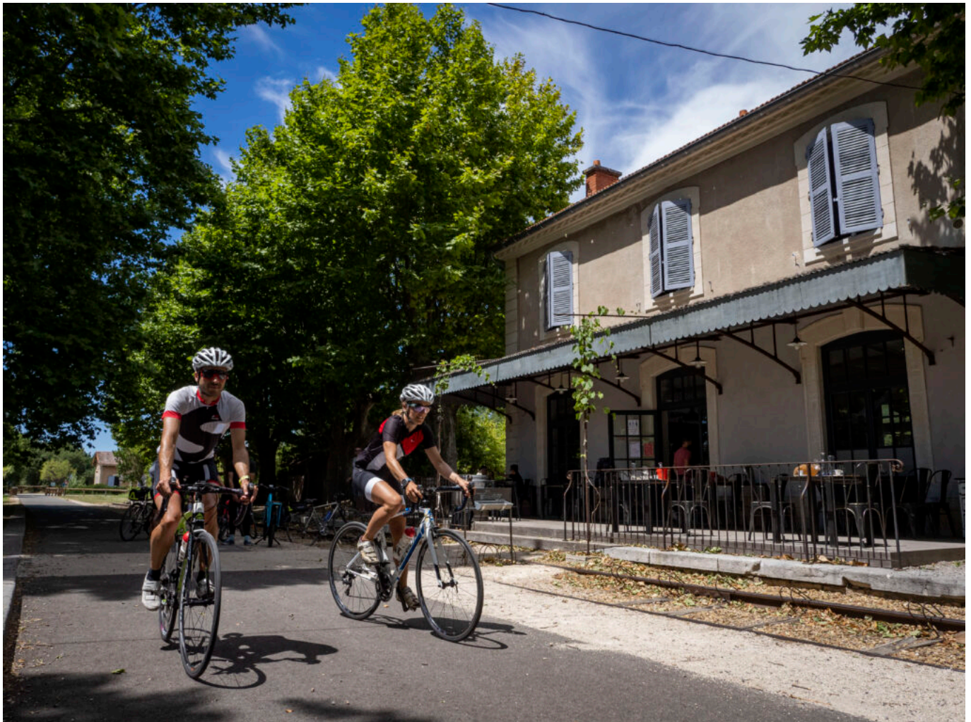
Gare de Lorient-du-Comtat sur la Via Venaissia

L'évolution du nombre de loueurs de vélos est également un autre indicateur intéressant. Leur nombre est passé de 10 à 20 en quelques années. Le réseau de professionnels affilié à l'association Vélo Loisir Provence, compte aujourd'hui, 56 hébergeurs, 20 loueurs, 8 restaurants, 8 caves, 5 accompagnateurs, 5 agences de voyages et 3 transporteurs. Certains bâtiments comme les anciennes gares SNCF de la vélo route du Calavon sont transformées en restaurants ou en lieux d'exposition culturel. C'est tout un éco système qui est en train de se constituer autour du vélo.