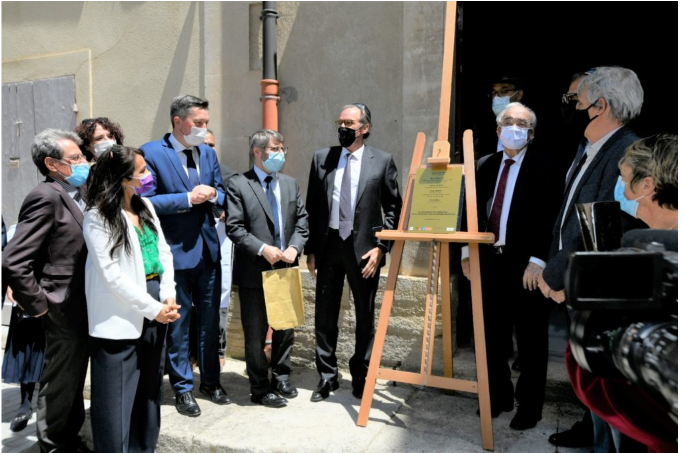
Le dévoilement de la plaque inaugurale a rassemblé un aéropage d'élus locaux et de représentants religieux.