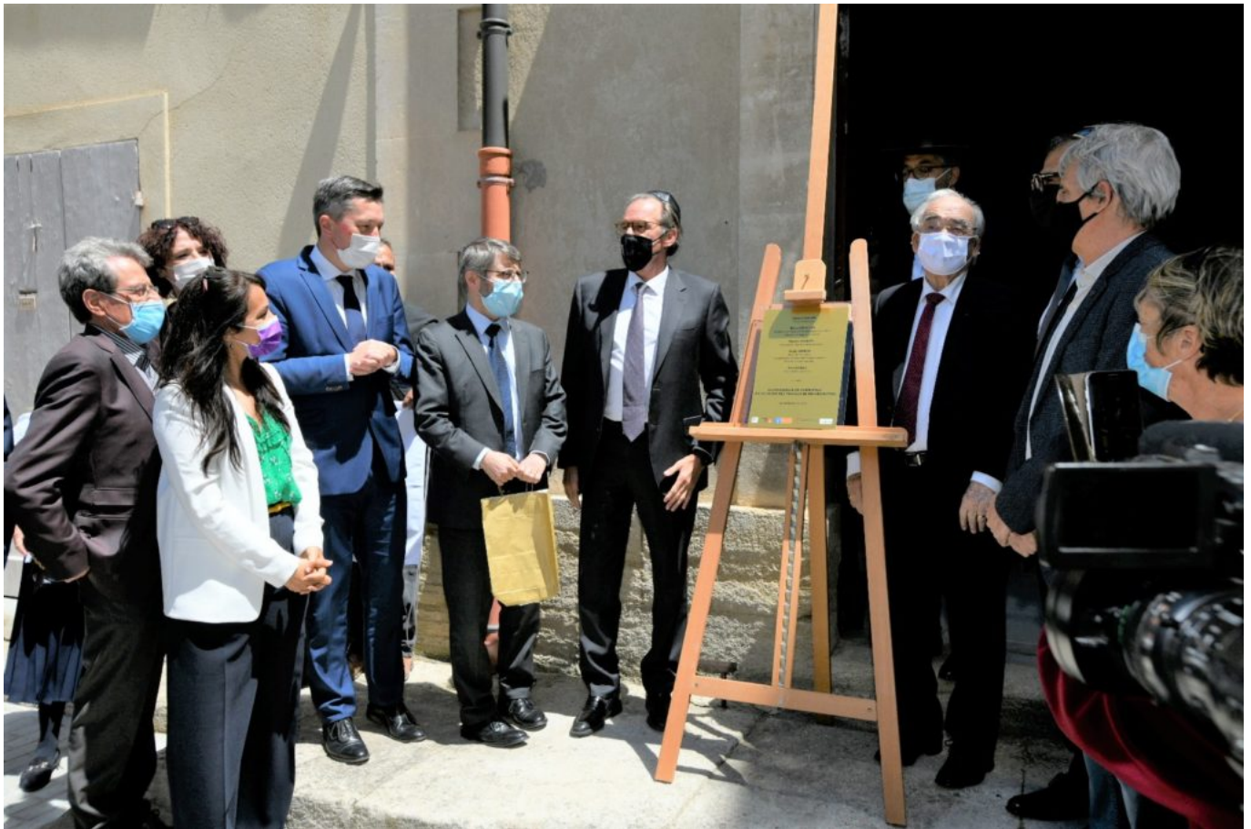
Le dévoilement de la plaque inaugurale a rassemblé un aéropage d'élus locaux et de représentants religieux.