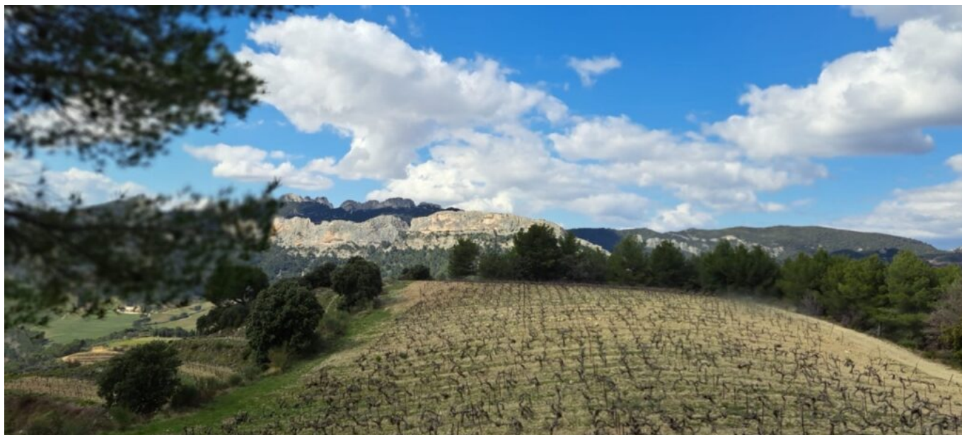
Les Dentelles de Montmirail.

Le président résume l'histoire de ce terroir escarpé qui date de quatre millénaires, avec les colons grecs qui ont planté les premiers pieds de muscat, une terre qui a été façonné par la vigne. Avec un mille-feuilles géologique, constitué de couleurs différentes. Des tranches superposées de trias rouge, de jurassique gris, de crétacé blanc et de miocène blond, toutes empilées les unes sur les autres. Et les Dentelles qui ont fait leur apparition il y a 5 millions d'années. « Tout cela constitue un sous-sol unique, avec des paysages à couper le souffle, entre oliviers, abricotiers, câpriers, impressionnantes lames grises et pierres sèches des restanques où l'amplitude de la température la nuit est de 6° entre le sud à Aubignan par exemple et le nord à Suzette et des vendanges qui sont décalées de 8 à 15 jours selon les parcelles. »