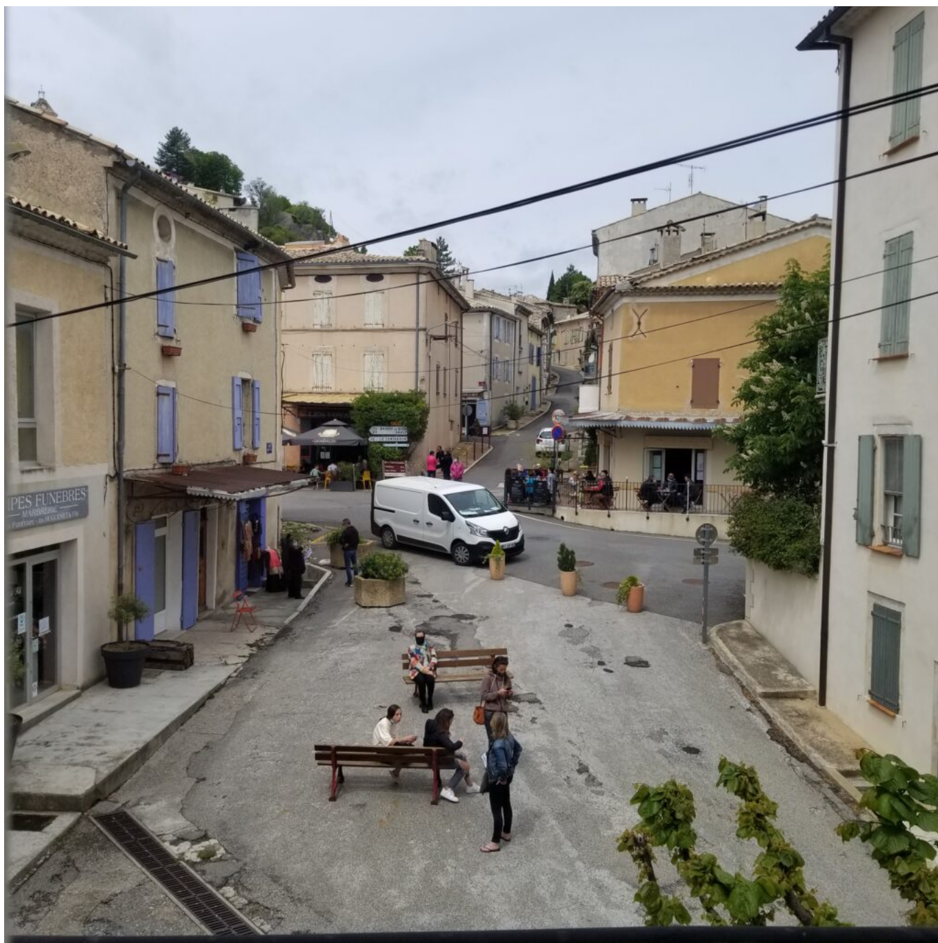
Vue depuis les fenêtres de la Librairie Le Bleuet sur la place Saint Just à Banon