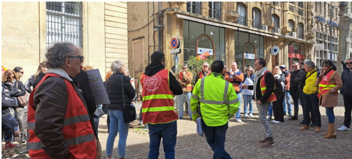
Un appel à une manifestation inter-syndicale et unitaire a été lancé pour le 3 avril à Avignon