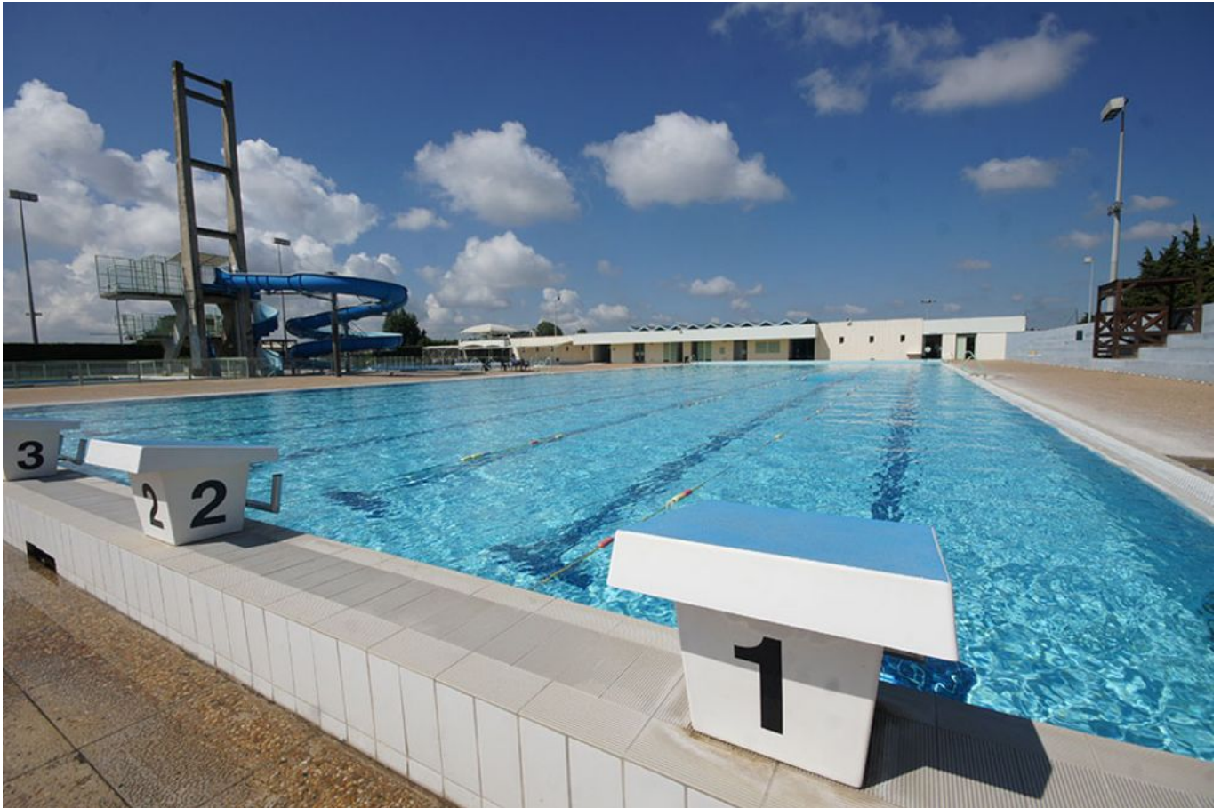
Photo: stade nautique de Carpentras