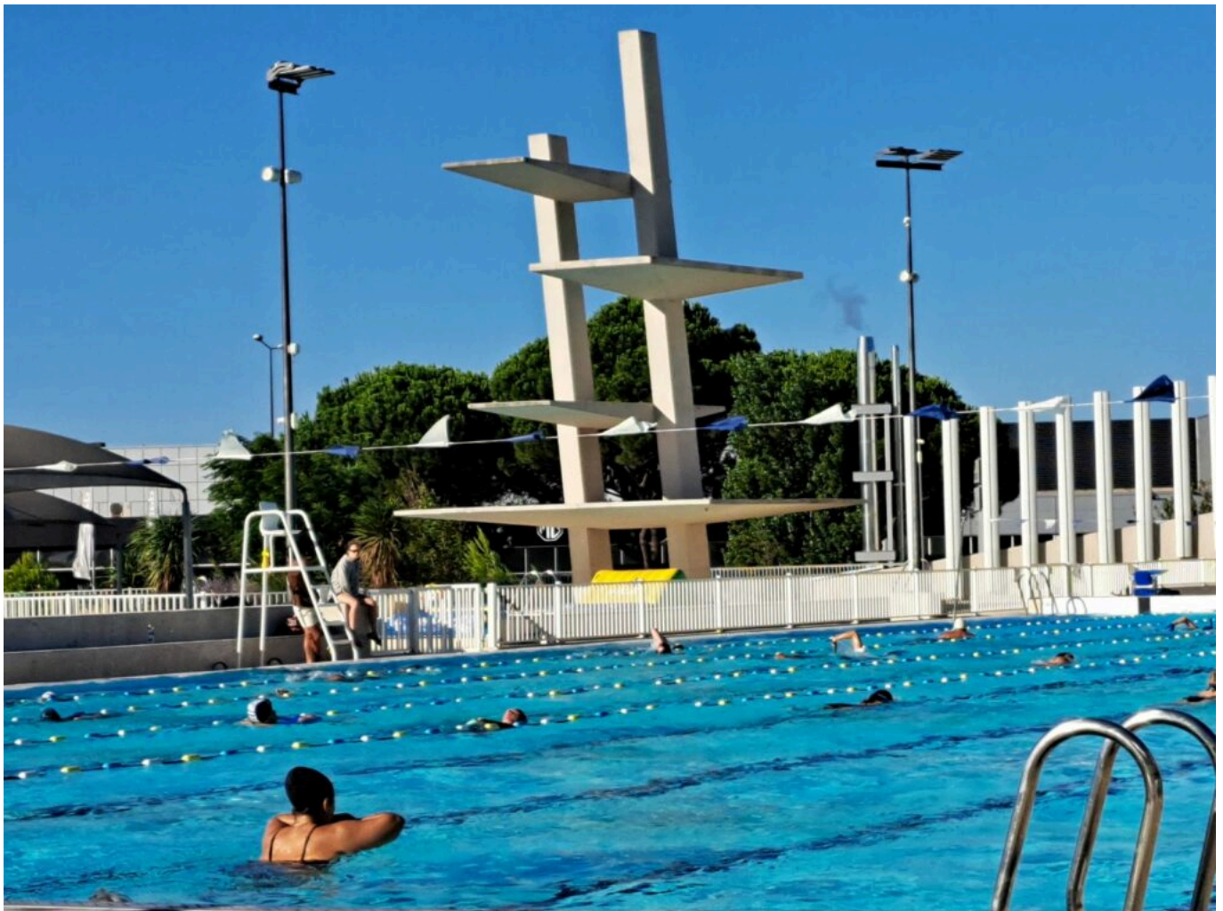
Le plongeur iconique du Stade Nautique d'Avignon

Et comme l'avait dit Bertrand Gaume, le précédent préfet de Vaucluse, en décembre 2019, quand il avait inauguré le Stade Nautique rénové aux côtés de Cécile Helle : « Apprendre à nager à tous les élèves est une priorité nationale inscrite dans le socle commun de connaissances et de compétences ».