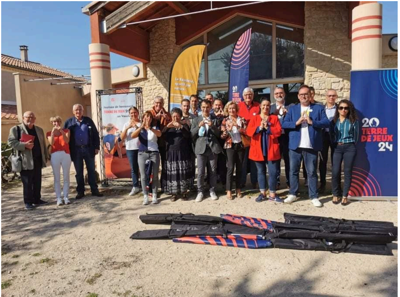
Rassemblement des 25 communes Vauclusiennes labellisées Terre de Jeux 2024 à Rasteau.