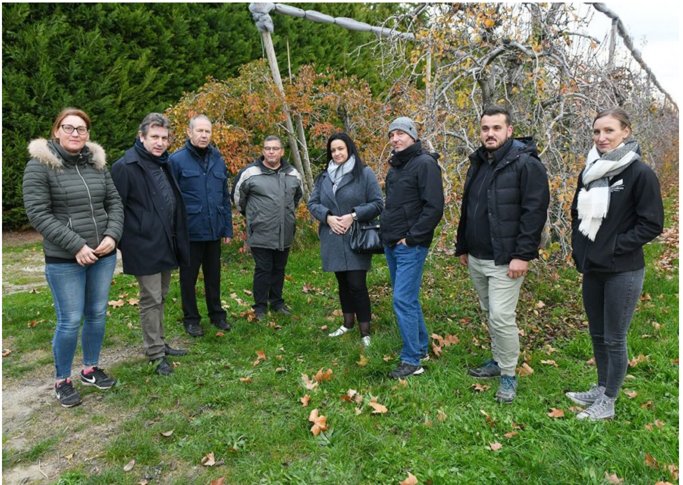
Visite de la société civile d'exploitation agricole « La Perrine » à Sorgues.