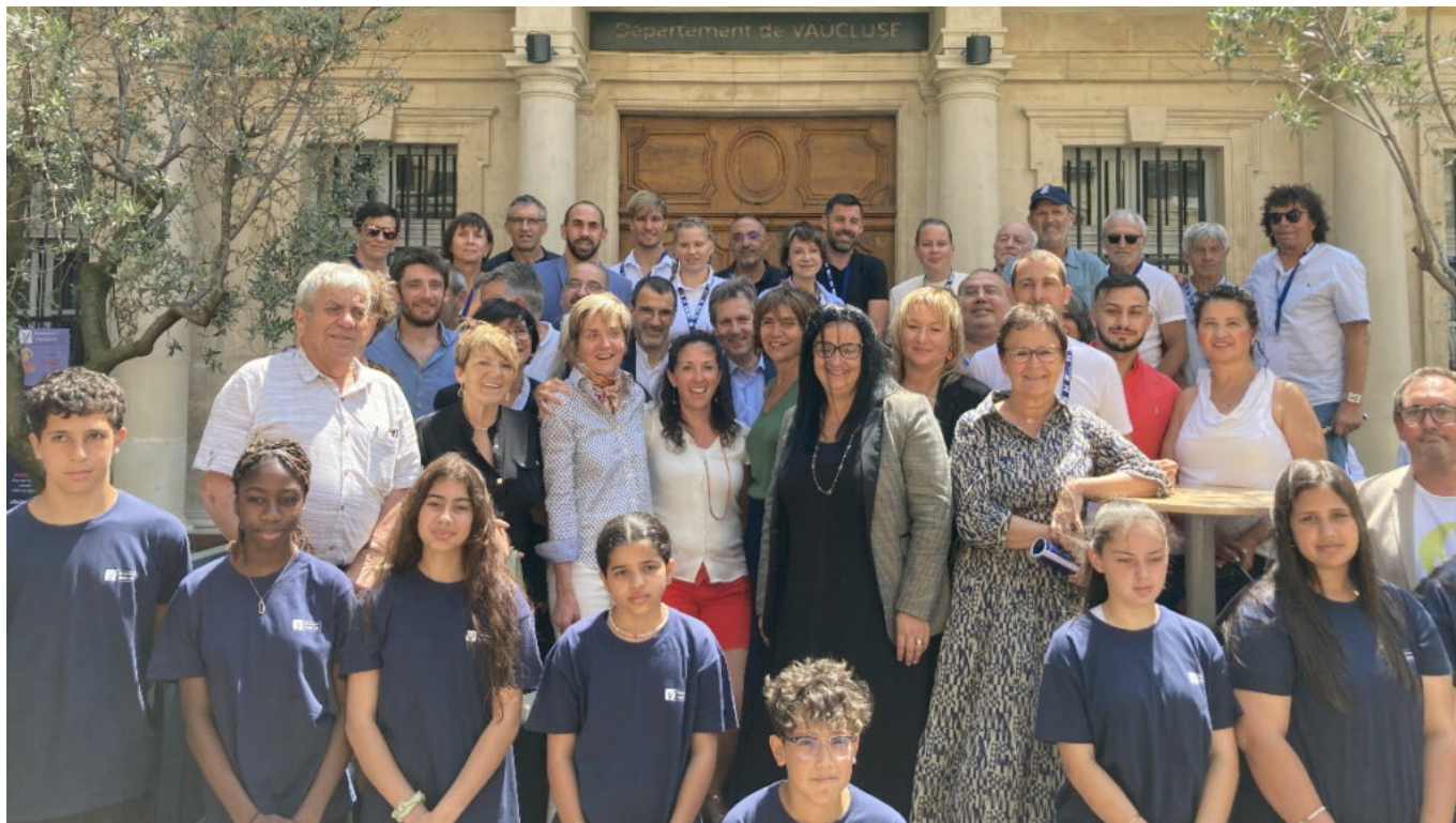
Elus, sportifs et enfants réunis pour le lancement des festivités