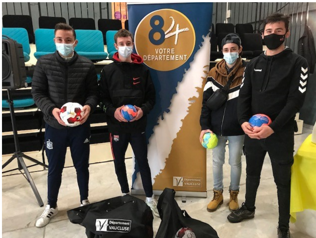
Remise de 418 ballons au Centre départemental de plein air et de loisirs à Rasteau.