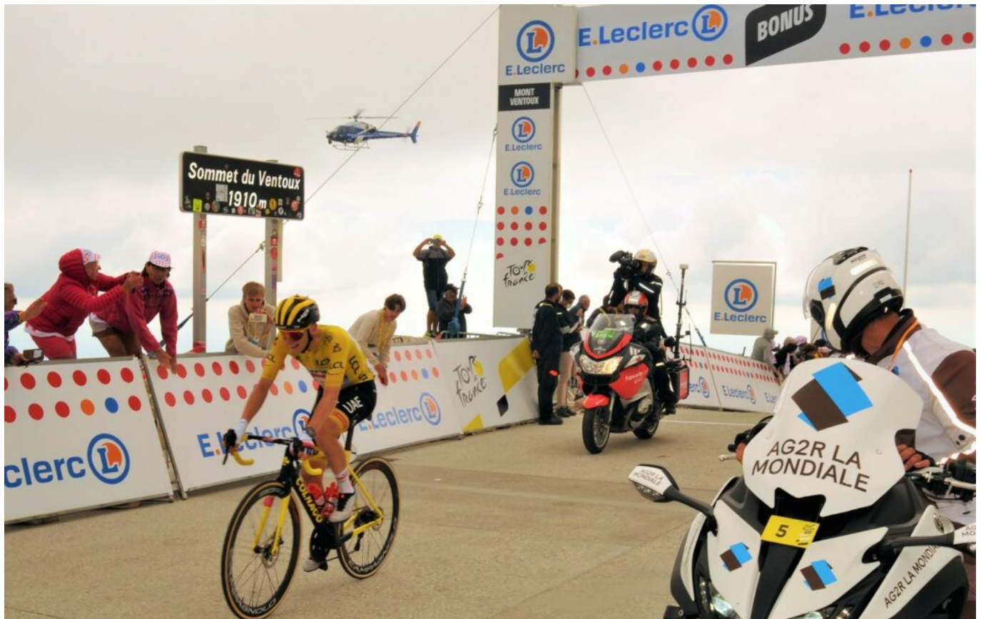
Tadej Pogačar, le maillot jaune, au sommet du Ventoux en 2021.