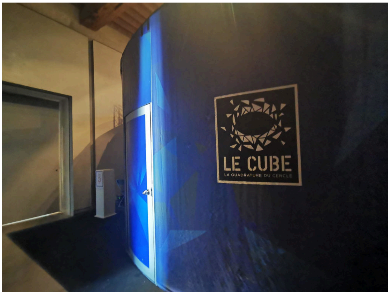
Le cube se dresse et vous appelle à l'évasion.