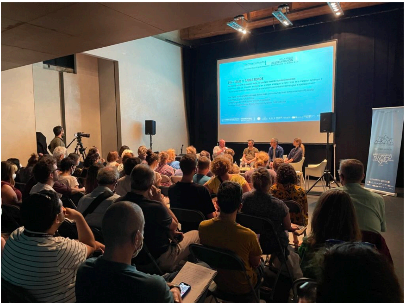
Carton plein pour les rencontres de la French Tech Grande Provence.