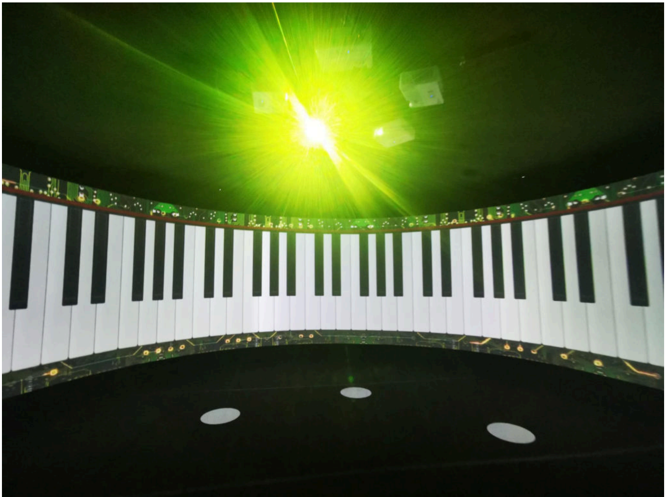
Le pianocktail vous attend au Grenier à sel.