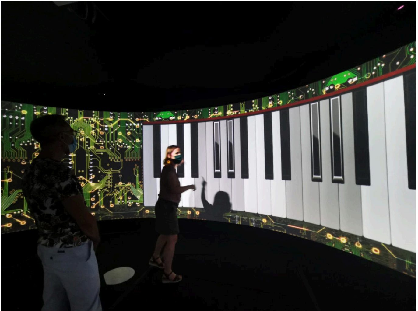
Dans le cylindre, la production vous emporte.