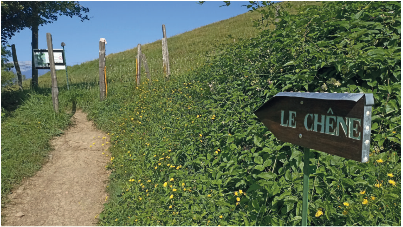
Une pancarte indique la direction du chêne de Venon