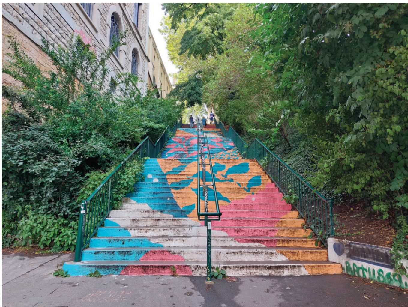
La montée des carmélites, un autre escalier hautement « instagrammable »

En arpentant les pentes, d'autres marches se sont parées de couleurs. Les escaliers de la montée des Carmélites, avec ses contremarches fleuries et vives, se lient très bien avec la végétation qui l'encadre. Cette fresque orange, bleu et rose a été réalisée en septembre 2022 par l'artiste Bambi Bakbi, mais aussi par des habitants. Au bout de l'escalier, le plus ancien jardin de Lyon et son amphithéâtre des trois Gaules attendent les visiteurs avec la verdure, le calme et le repos comme récompense. En poursuivant, on peut se rendre rue Saint-Polycarpe, où se cache une micro-brasserie, la Beer Fabrique. « Ici, c'est comme un cours de cuisine mais on fait de la bière », explique Lorris Martiningo, gérant et brasseur de l'établissement. Dans ces ateliers, les clients apprennent d'ailleurs des techniques de brassages qu'ils peuvent reproduire chez eux. Pour mieux aiguïser les papilles de ses visiteurs, la brasserie propose aussi des événements alliant cuisine et bière. Elle y a, par exemple, déjà décliné les thématiques de la gastronomie, du pâté en croûte ou des desserts.