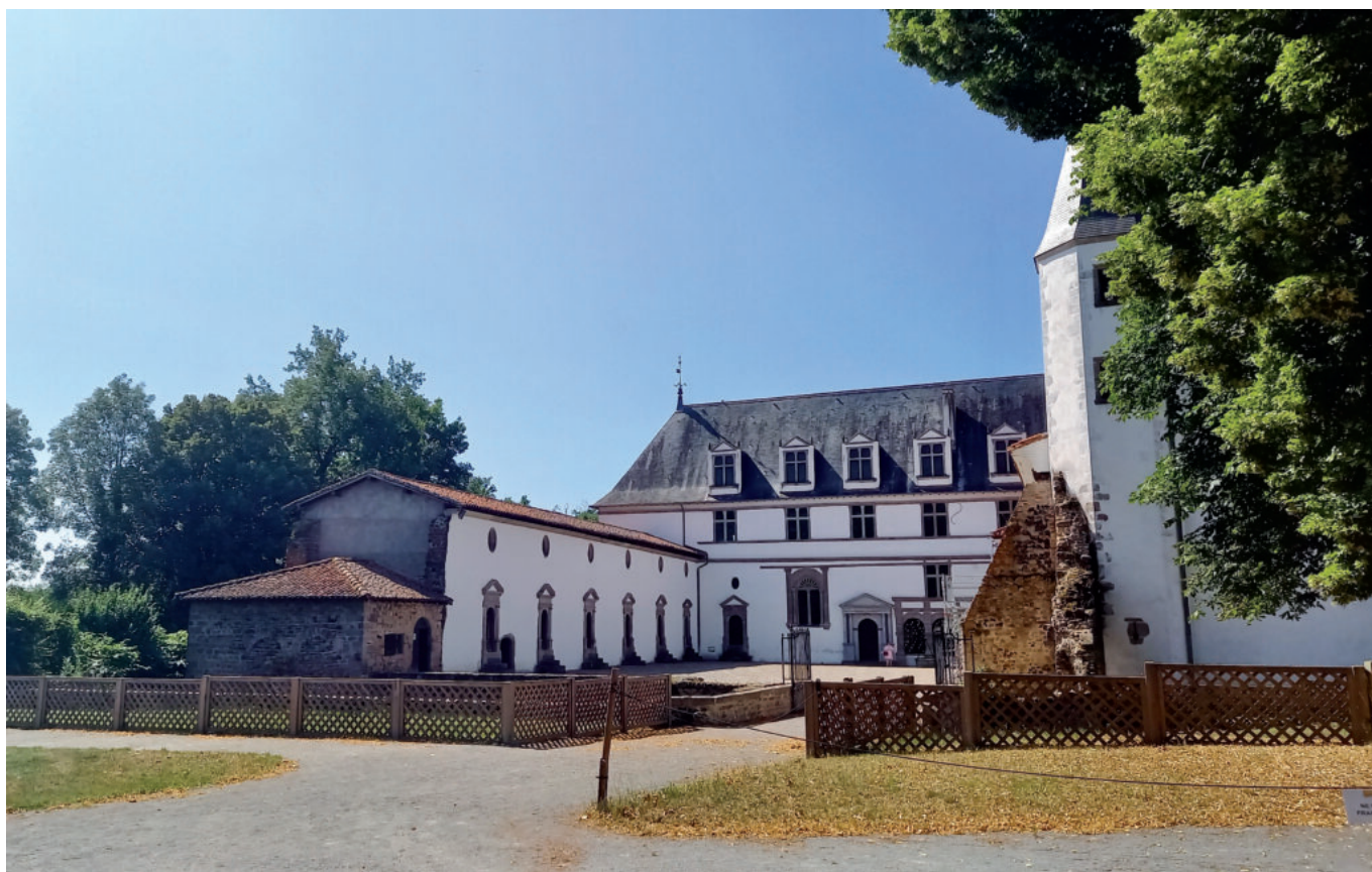
Le site au charme si particulier