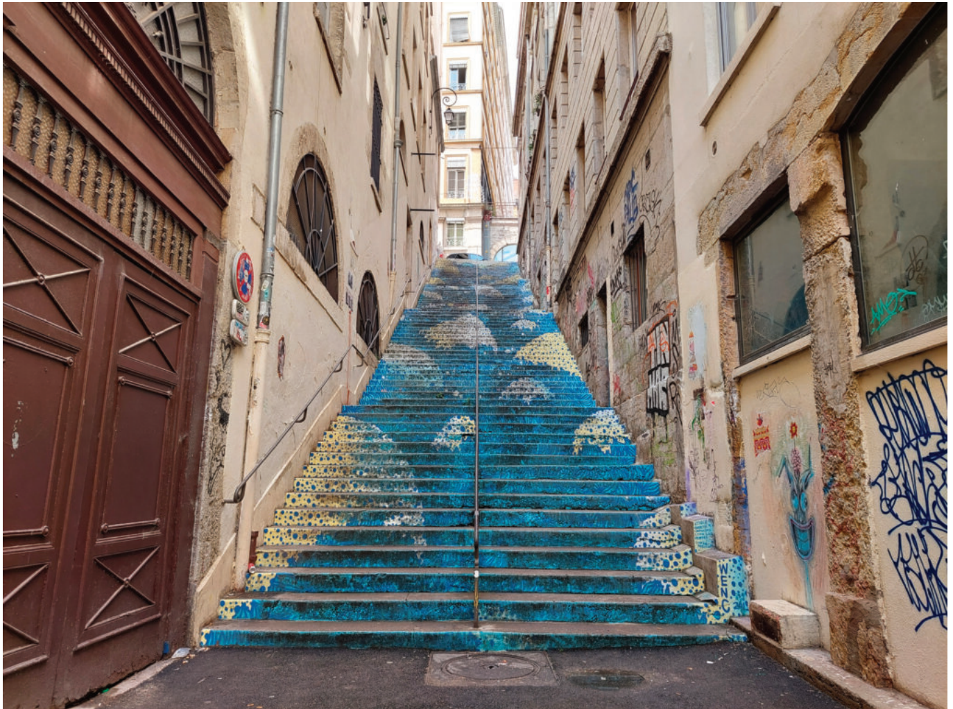
L'escalier Mermet et ses 80 marches vertigineuses

original et pour une fois, la récompense ne se trouve pas au sommet, mais bien en bas des marches.