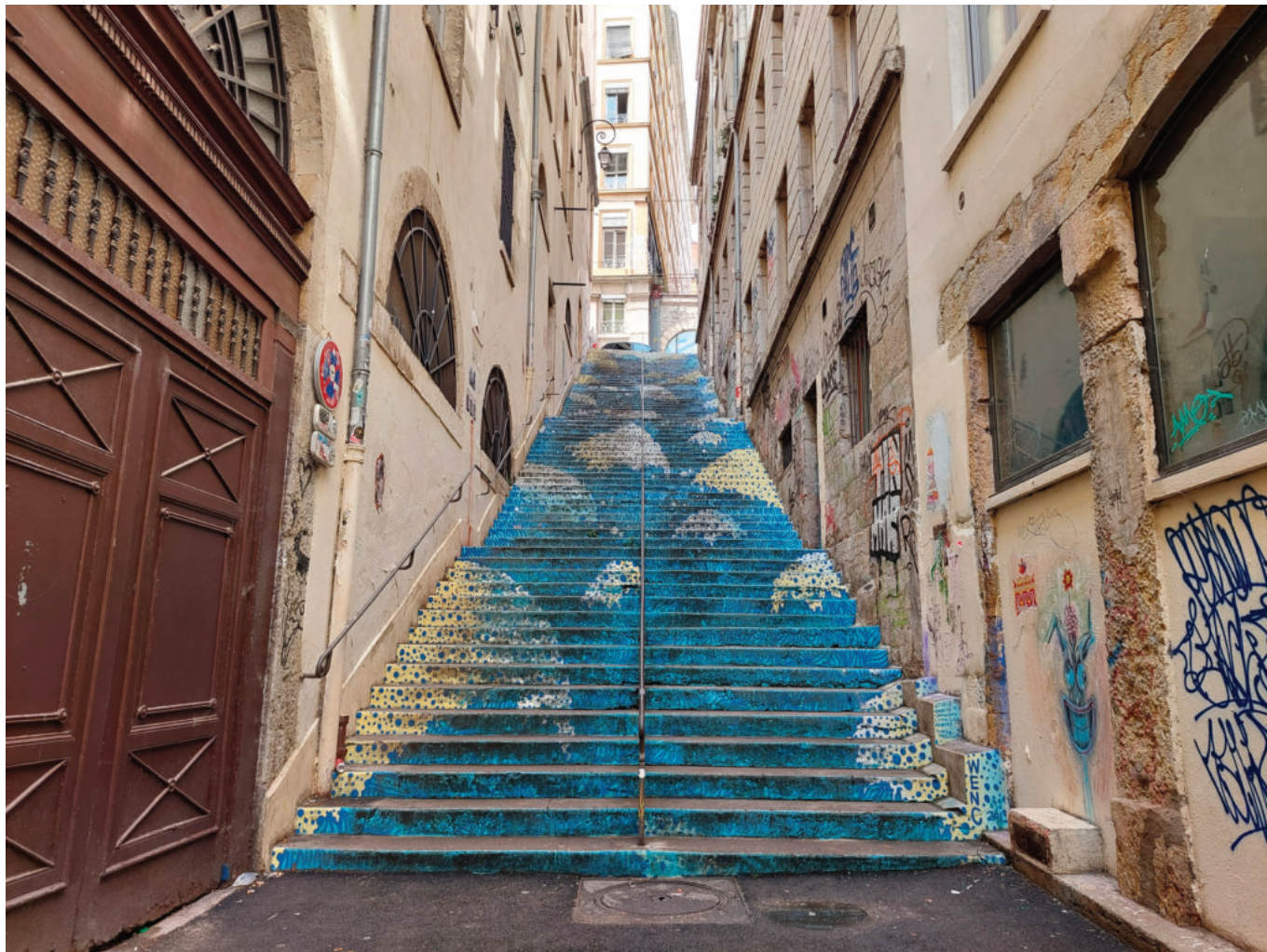
L'escalier Mermet et ses 80 marches vertigineuses

original et pour une fois, la récompense ne se trouve pas au sommet, mais bien en bas des marches.