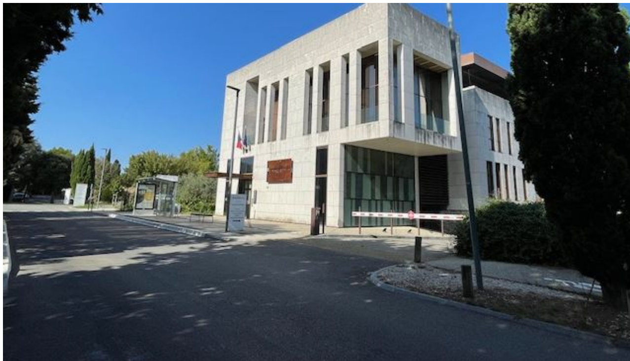
La Banque de France, Agroparc, Avignon