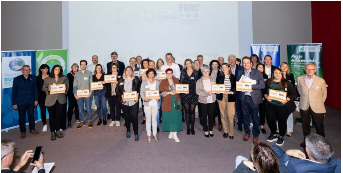
Les lauréats du label+.