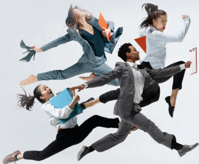
Illustration : Laurent Combarrière - Ville de Sorgues

GRATUIT MARDI 27 SEPTEMBRE SALLE DES FÊTES • SORGUES