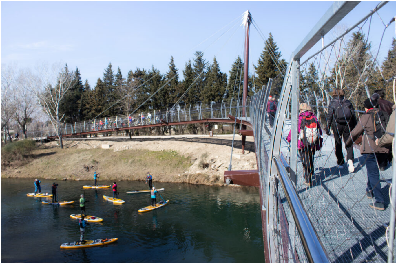
La passerelle himalayenne de Sorgues enjambant l'Ouvèze

La passerelle contribue à promouvoir les modes doux de déplacement, une nouvelle liaison entre certains quartiers isolés du centre-ville de Sorgues et de l'Ouvèze qui joue un rôle de frontière naturelle. Elle a également pour objet de développer l'attractivité du centre-ville et de redynamiser le commerce, de booster l'attractivité touristique, notamment via la fréquentation de la voie Rhône, et, surtout, d'accroître, au quotidien, la qualité de vie des habitants et visiteurs.