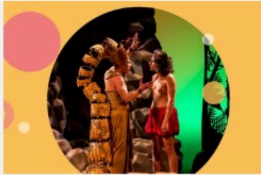
Le livre de la jungle