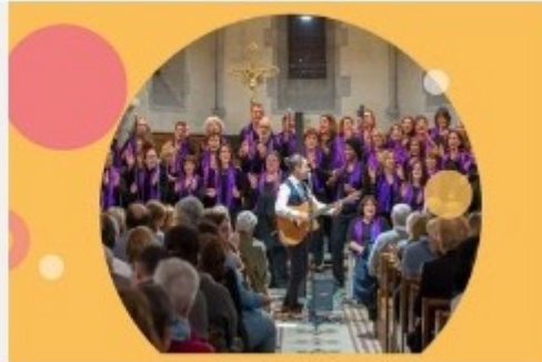
Avignon Gospel Time