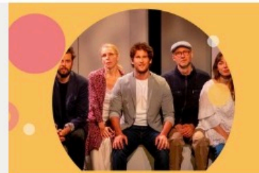
La vie est une fête