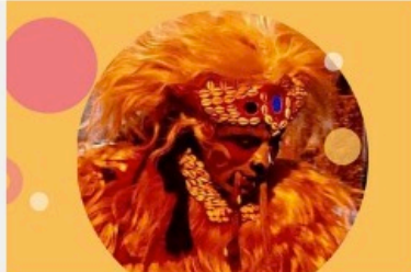
Le faux lion de Saint-Louis du Sénégal