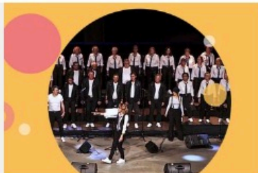
Berger Balavoine... La Story