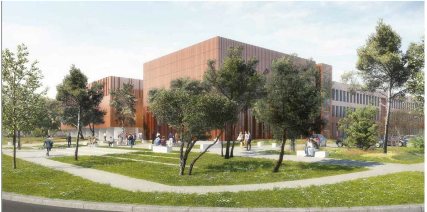
Memento à Agroparc.