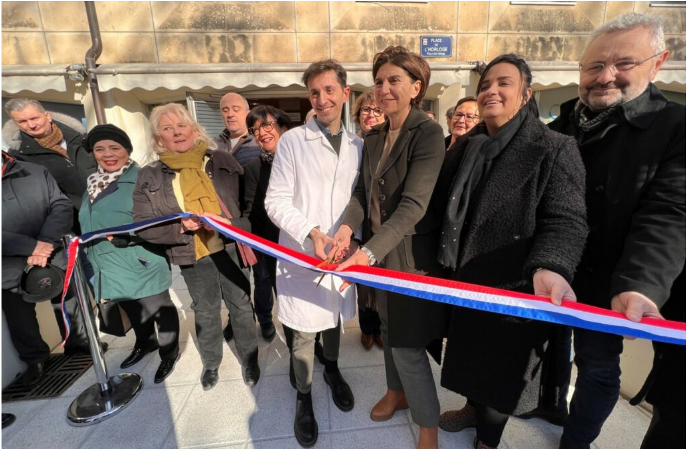
Inauguration de la maison de santé à Avignon en février dernier.

« Les Vauclusiens ont envie de vieillir chez eux. »