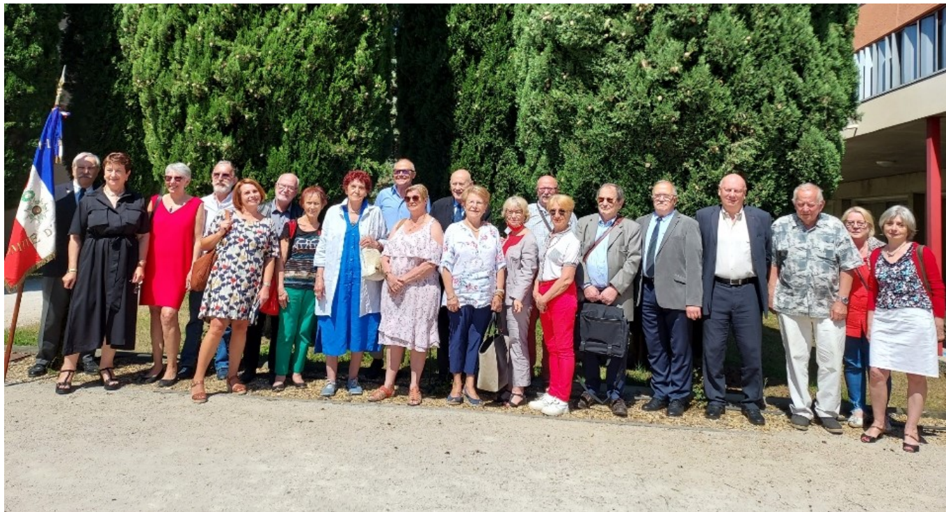
Les membres de la SMLH (Société des Membres de la Légion d'Honneur) de Vaucluse.