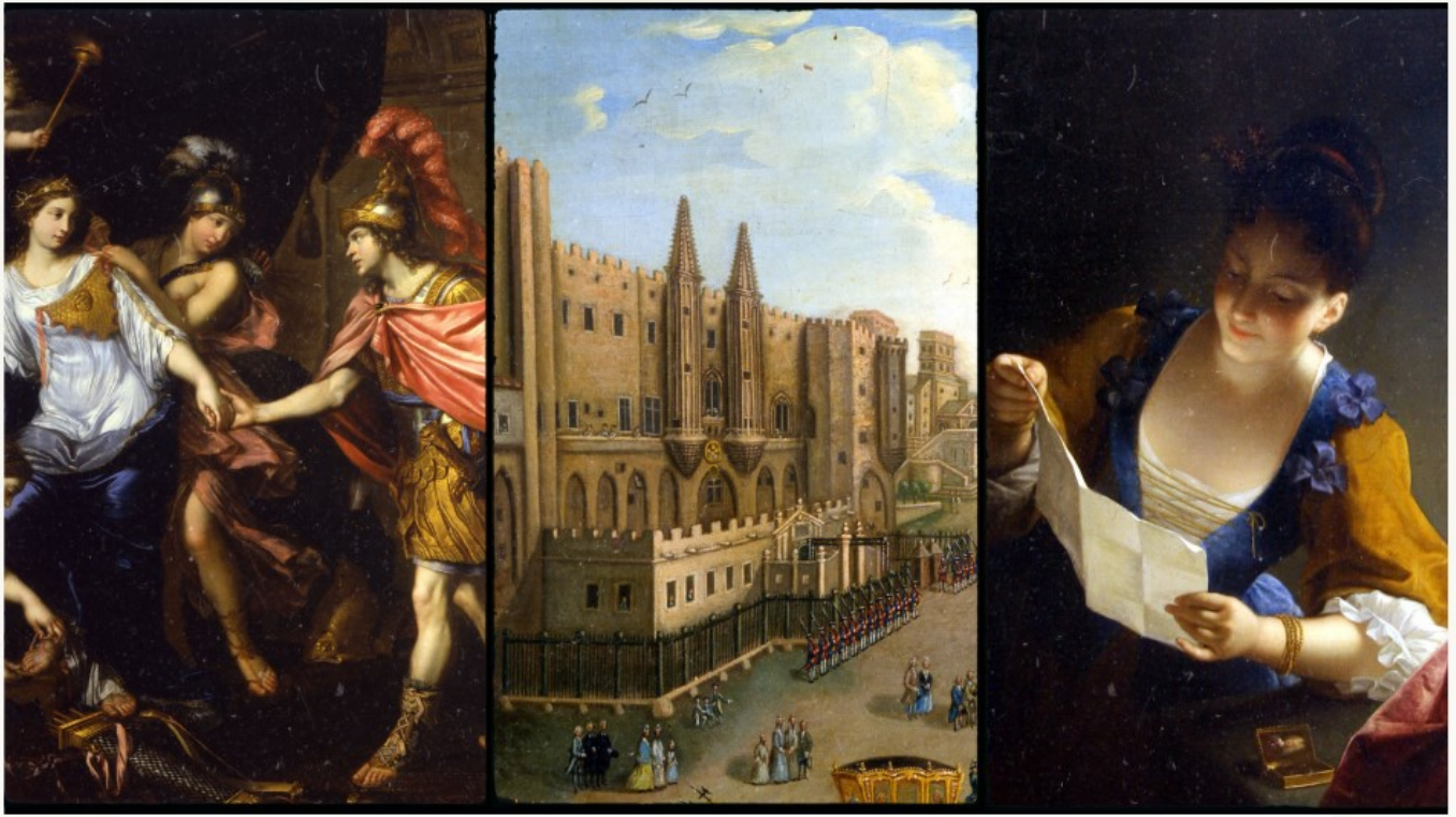
MIGNARD P- La rencontre d'Alexandre avec la reine des Amazones