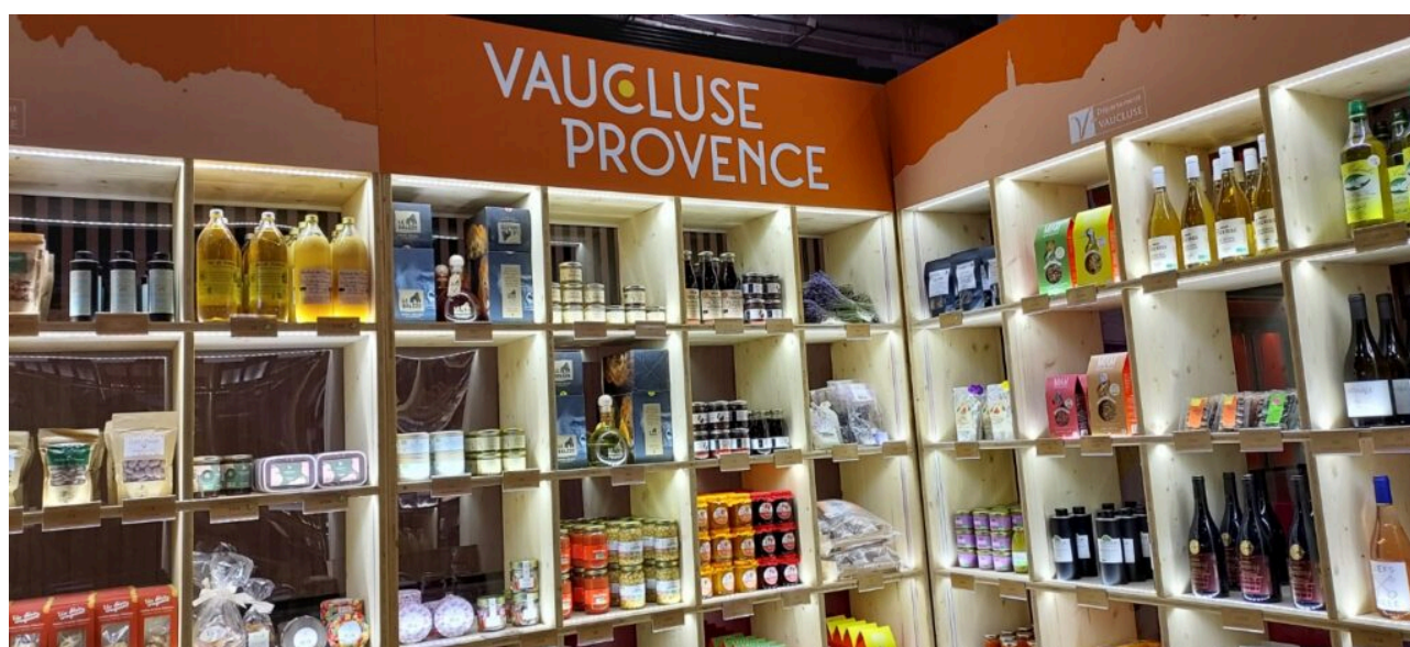
L'épicerie gourmande du Vaucluse.

Le président Renaud Muselier s'est aussi félicité du coup d'arrêt d'un arrêté « véritable rouleau compresseur européen contre le lavandin et de sa supposée dangerosité neurotoxique au-delà de 8% de camphre. Il est suspendu mais pas définitivement, le combat doit continuer ».