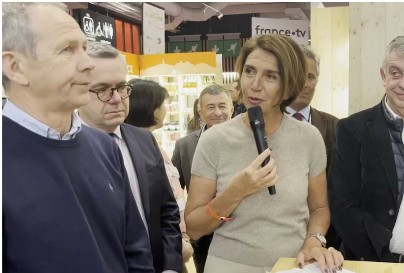
La présidente du Conseil départemental de Vaucluse.