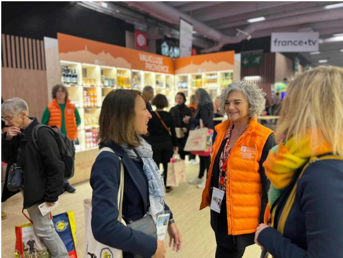
Le stand du Département de Vaucluse au Salon de l'agriculture 2023.

désormais agriculteurs et apiculteurs travaillaient main dans la main, en bonne intelligence, pour installer des ruches aux abords de leurs champs. « Ils ont besoin des abeilles pour polliniser les fleurs qui donneront des fruits. Sans elles, c'est comme sans eau, pas d'agriculture possible. Il faut que nous cohabitons sereinement. Avec des prairies, comme à Châteauneuf-du-Pape où 42 km de haies vont être plantés, un 'Marathon de la biodiversité' avec les jeunes vignerons de l'appellation. »