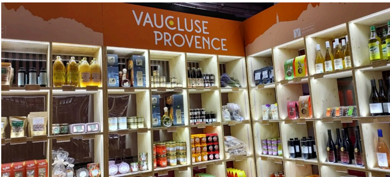
L'épicerie gourmande du Vaucluse.

Le président Renaud Muselier s'est aussi félicité du coup d'arrêt d'un arrêté « véritable rouleau compresseur européen contre le lavandin et de sa supposée dangerosité neurotoxique au-delà de 8% de camphre. Il est suspendu mais pas définitivement, le combat doit continuer ».