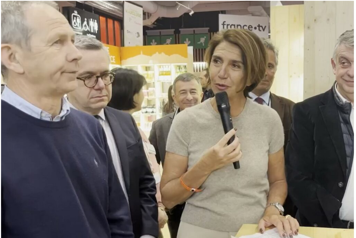
La présidente du Conseil départemental de Vaucluse.