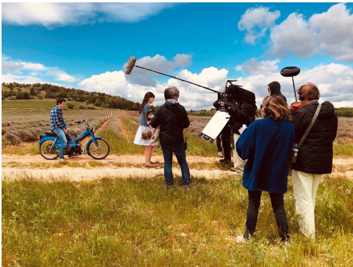
Tournage de 'Grand Ciel', filmé à Valréas et à Sault.