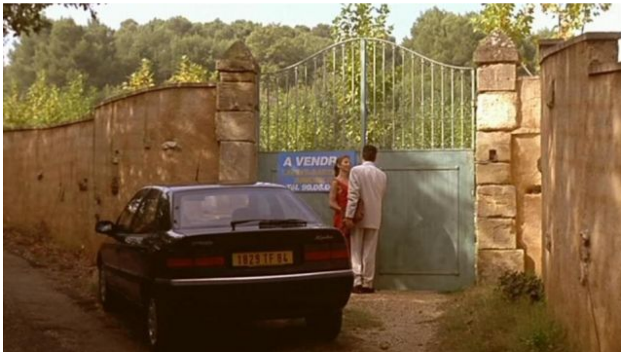
Le village d'Oppède-le-Vieux dans 'Gazon Maudit' avec Alain Chabat (1995)

« Nous devons intégrer le savoir américain tout en l'adaptant à la réalité du modèle français. D'où l'intérêt de fabriquer des programmes d'enseignement commun et de les étendre via les campus physiques ou numériques. Les enseignants et les personnes issues du métier sont légion dans le Vaucluse ou les départements limitrophes. »