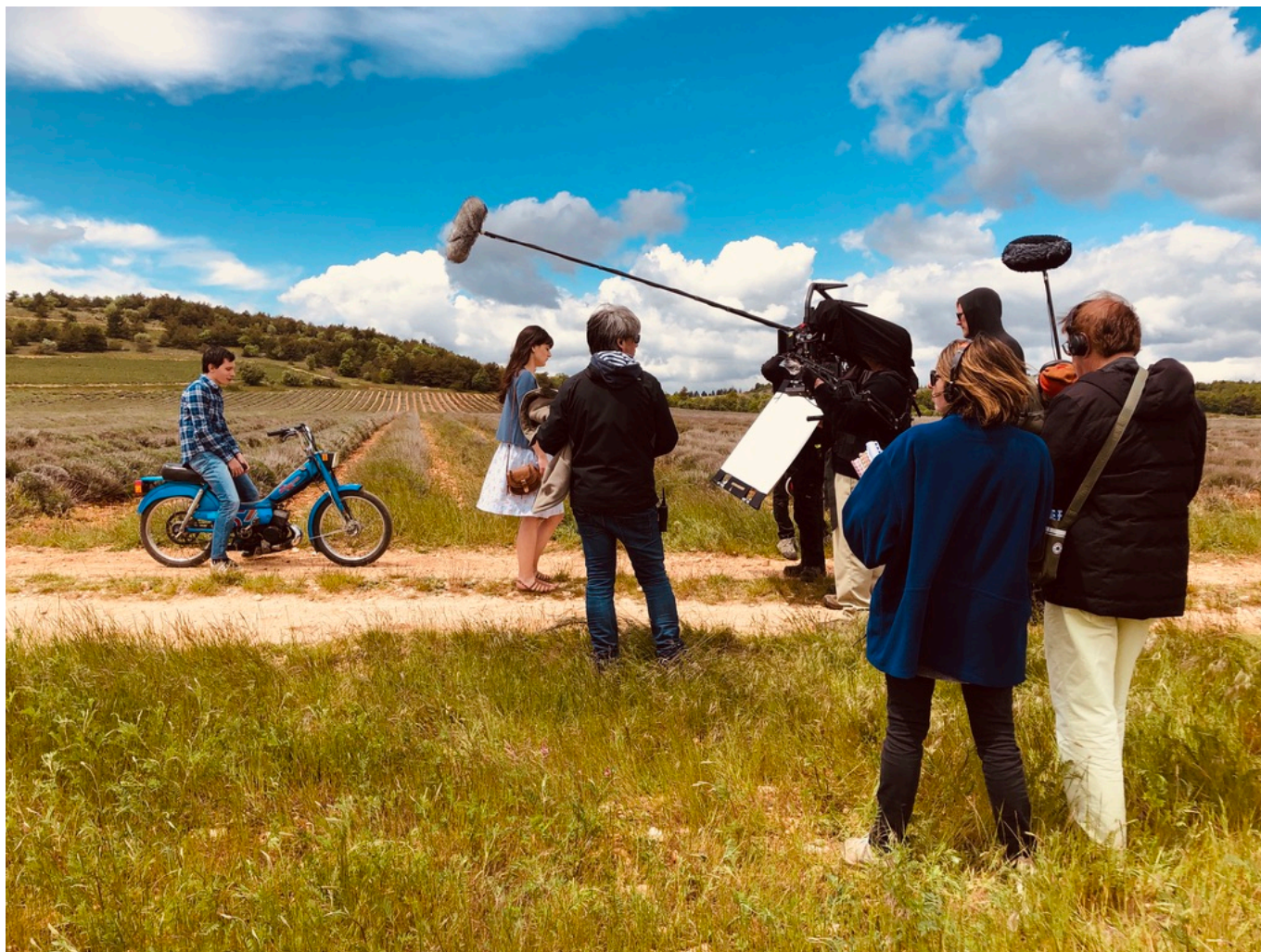
Tournage ' Grand ciel ', juillet 2019

L'attractivité est le maître-mot. « Il ne s'agit pas juste de faire comme les autres, il faut dessiner une stratégie cohérente, inclusive, et s'y tenir. Demain, la production se déroulera sans doute en Paca, au-delà de Marseille, ou potentiellement à Cannes. » La formation encourage par ailleurs la sédentarité avec des débouchés d'emploi et attire par la même occasion d'autres métiers de services.