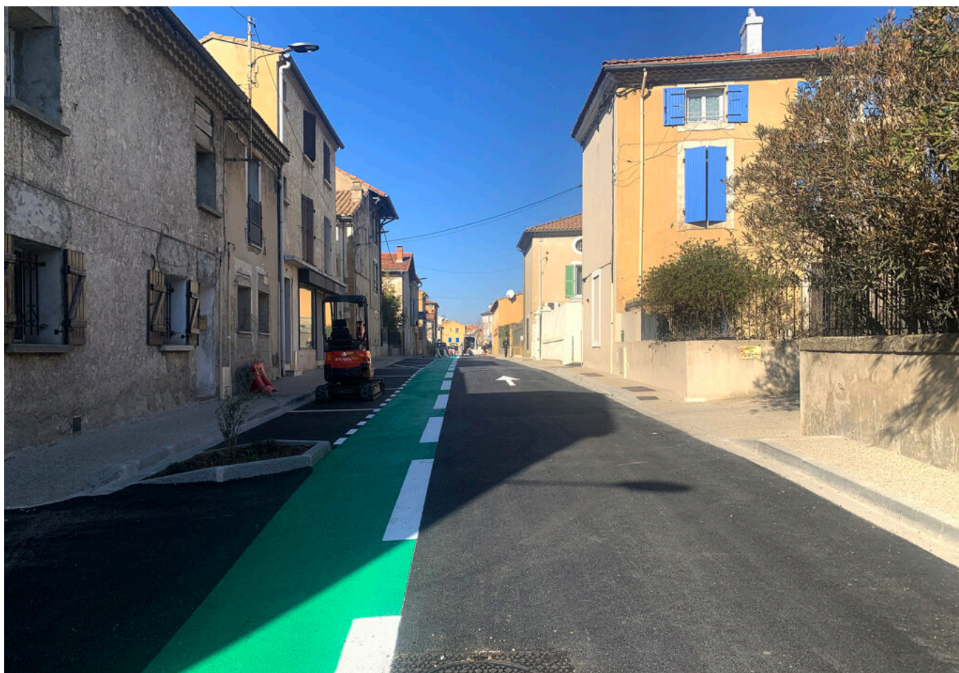
Ville de Sorgues