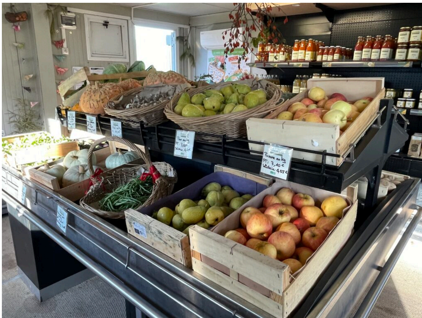
La boutique Semailles

(Vidéo) 'Bien bon !' le Bilan, 100 acteurs locaux y ont participé et 15 000 personnes y