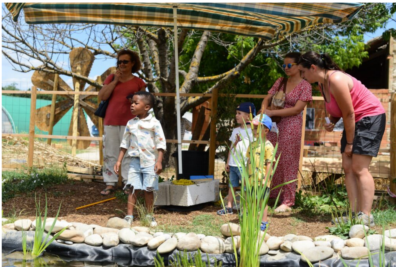
Atelier Découverte des habitants de la mare

Semailles permet à des femmes et des hommes de peaufiner leur projet d'emploi ou de formation tout en étant dans l'action, grâce aux activités de maraîchage et d'éducation à l'environnement et au développement durable (EEDD). « Vous avez besoin de légumes, ils ont besoin d'un travail. Ensemble cultivons la solidarité », telle est la politique de l'association. Chaque semaine, ce sont 350 avignonnais qui achètent les paniers proposés par l'association.