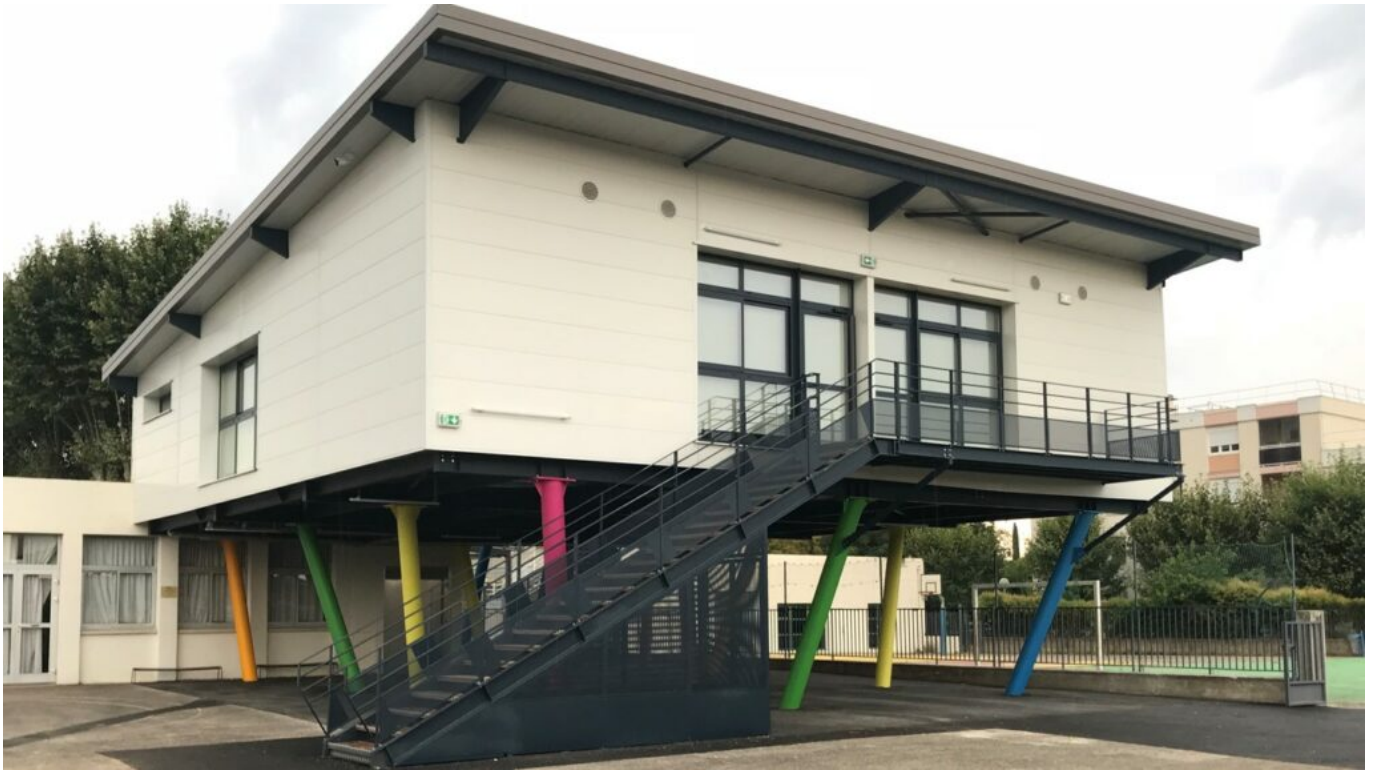
L'école Giono à Tarascon.