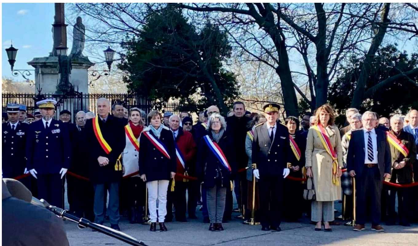
Le nouveau préfet avec les élus de Vaucluse ainsi que les représentants des services de l'Etat.