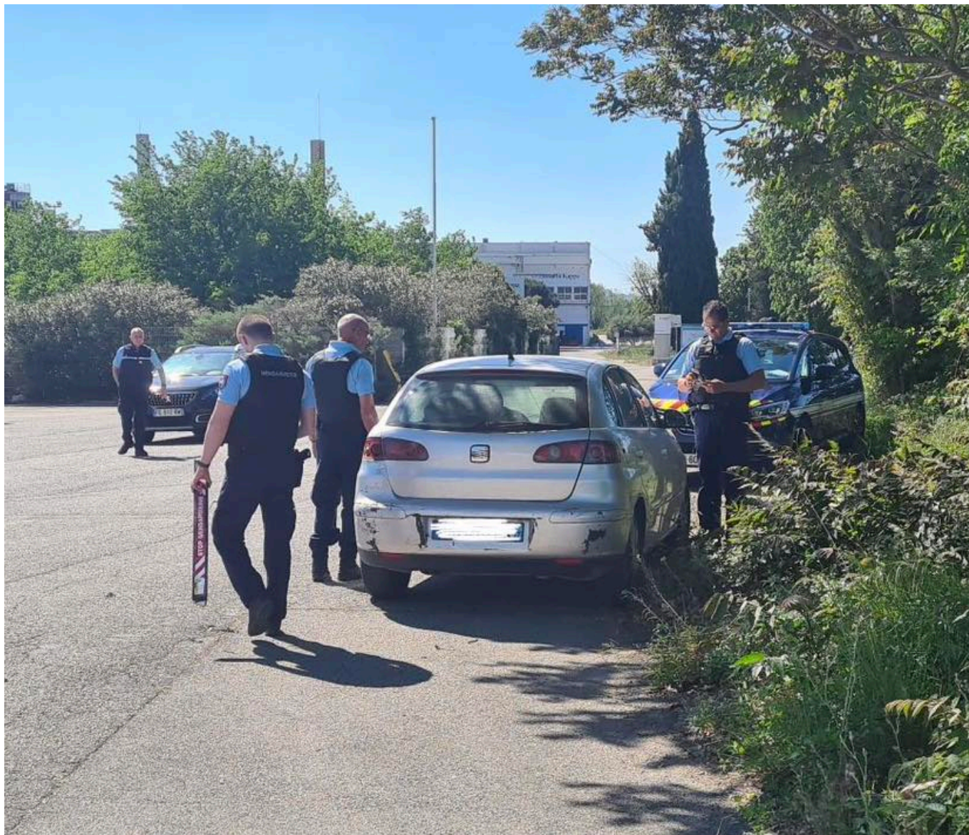
Trente gendarmes de Vaucluse étaient mobilisés pour cette opération de contrôle entre Le Pontet et Sorgues.