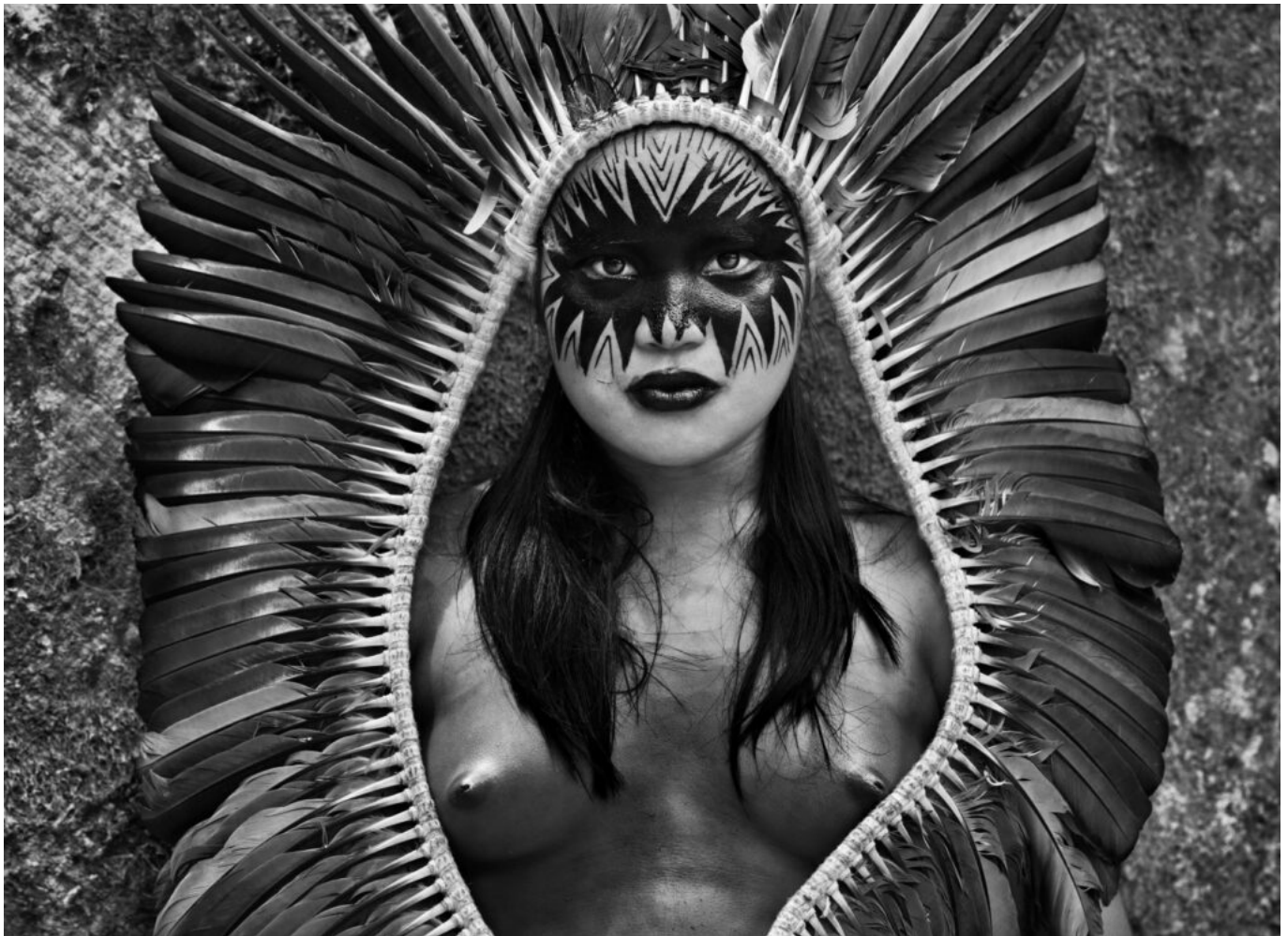
Indienne Yawanawá, État d'Acre, Brésil, 2016.