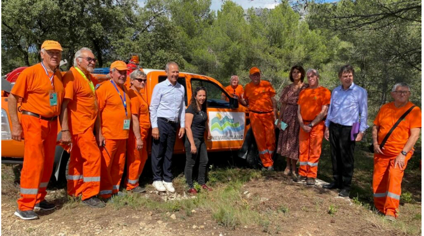
Les élus avec les bénévoles du CCFV de Cheval-Blanc.

incendiaires se retrouvent devant un tribunal ».