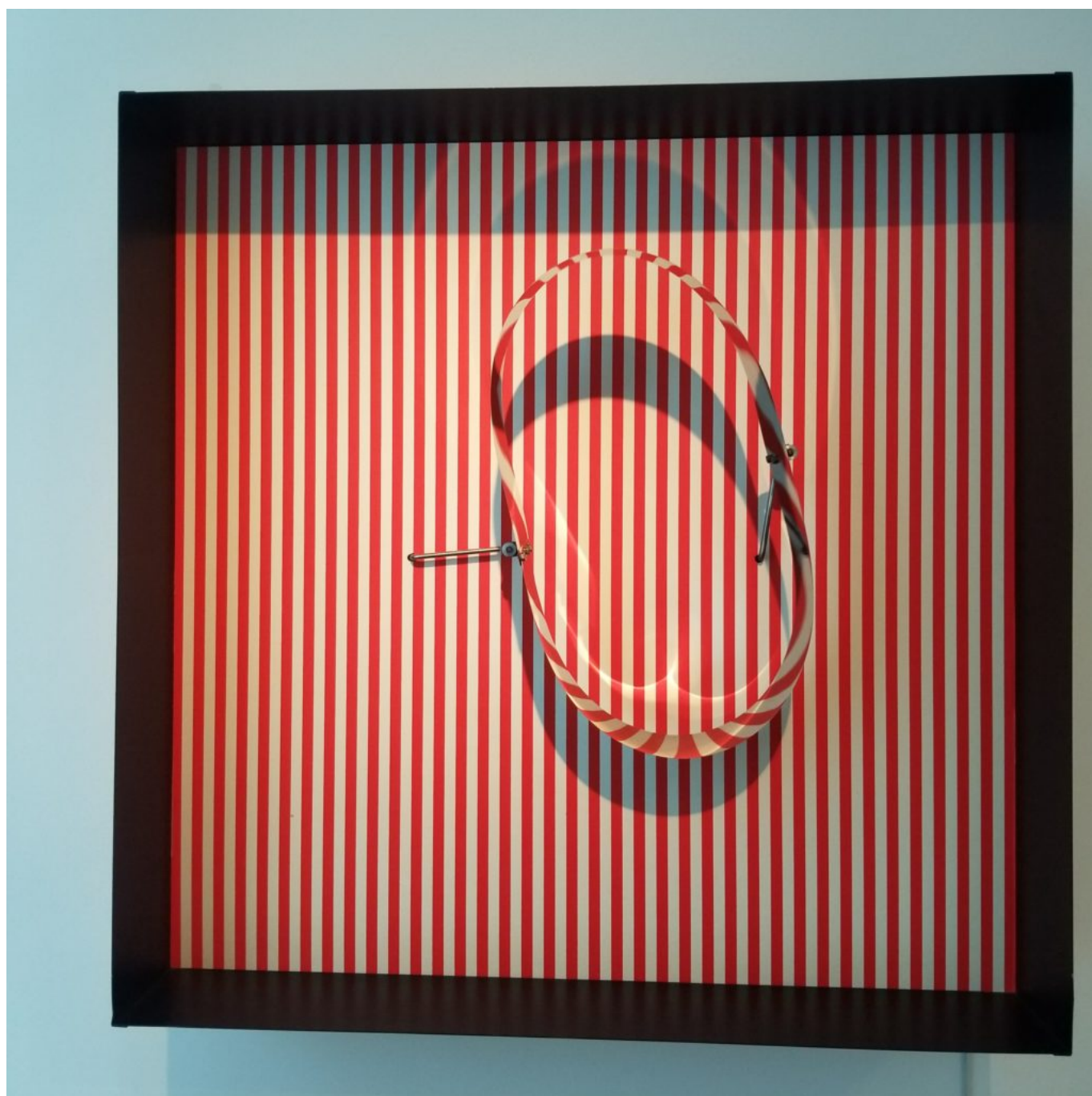
'Juste une illusion', art cinétique et optique