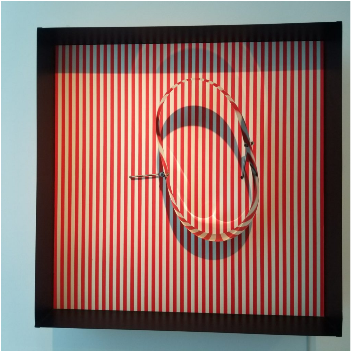
'Juste une illusion', art cinétique et optique