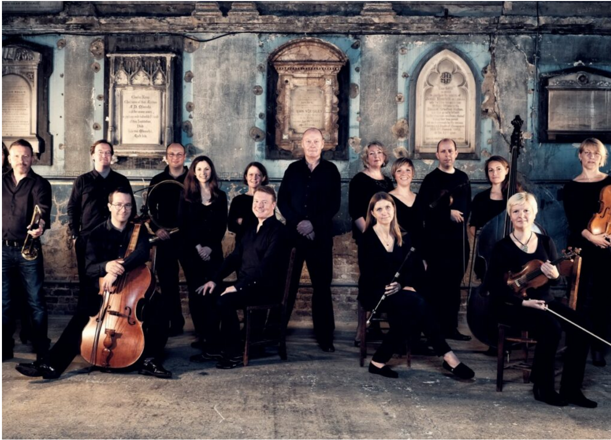
“King Arthur” par le Gabrieli Consort le 09 juillet place de l’Horloge à Ménerbes