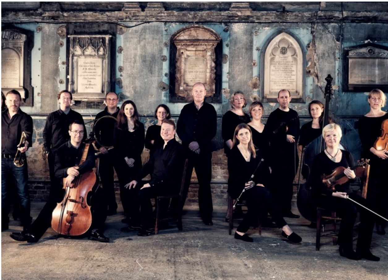
“King Arthur” par le Gabrieli Consort le 09 juillet place de l'Horloge à Ménerbes

A Ménerbes le 9 juillet, mais en plein air sur la Place de l'Horloge l'opéra « King Arthur » de Purcell qui sera dirigé par le londonien Paul Mac Creesh à la tête de son Ensemble Gabrieli Consort & Players et de sopranos, ténors baryton et baryton-basse réputés.