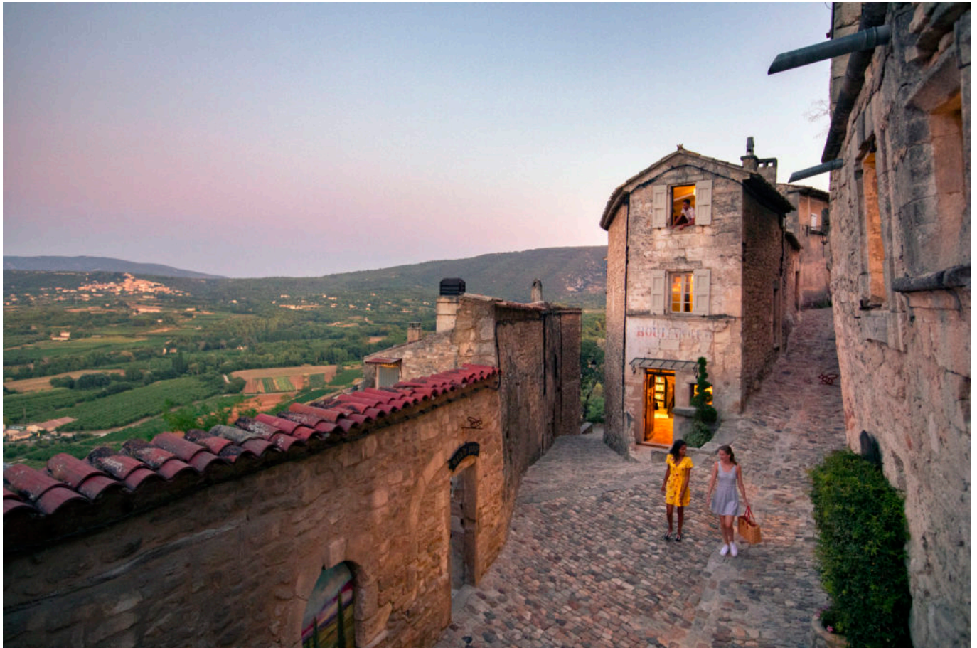
SCAD Lacoste, été 2019, rue du Four.

longévité puisqu'il fête cette année ses 20 bougies. Pour marquer le coup, rien de tel qu'un Festival du film inédit avec son lot de surprises ou une exposition consacrée à Isabel Toledo , créatrice de renom derrière la robe de Michelle Obama portée lors de l'investiture.