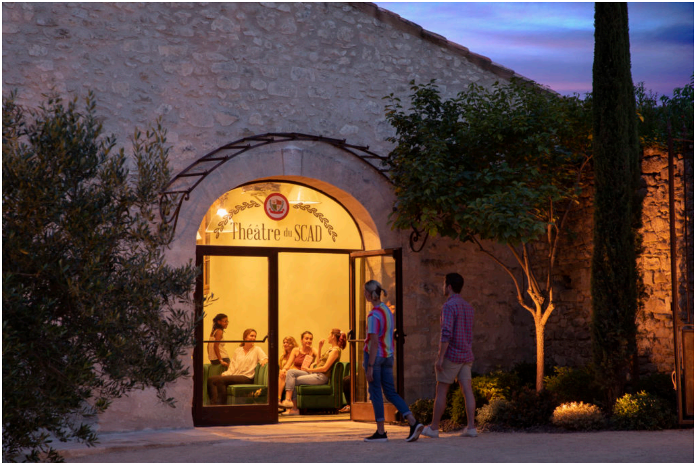
SCAD Lacoste, été 2019, théâtre.