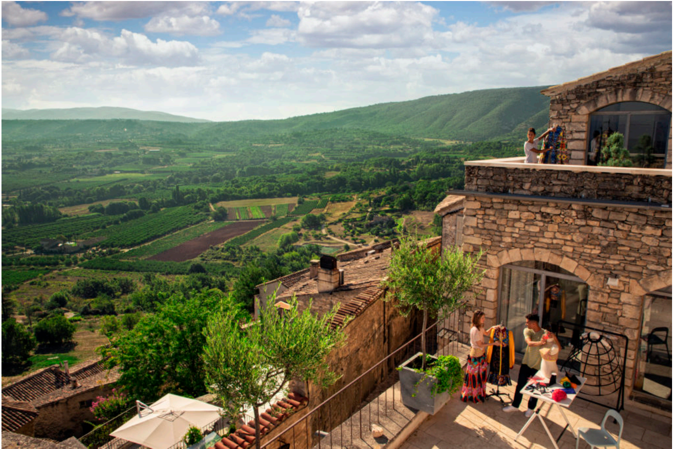
SCAD Lacoste, été 2019, discipline 'lifestyle et fashion'.

« Le village est magnifique, on a conscience qu'il est exceptionnel. On veut le valoriser encore plus et accompagner cette dynamique », appelle le directeur de ses vœux. Autre structure qui contribue au rayonnement du territoire : la galerie d'art. Les étudiants devenus artistes sont accueillis en résidence et proposent leurs œuvres. SCAD fait office d'agent et perçoit des commissions sur les ventes. Tout le campus forme une puissante galerie d'art avec sa boutique au centre : le shopSCAD . Concernant les financements, aucune subvention publique, pas même dans le cadre de la restauration des bâtiments.