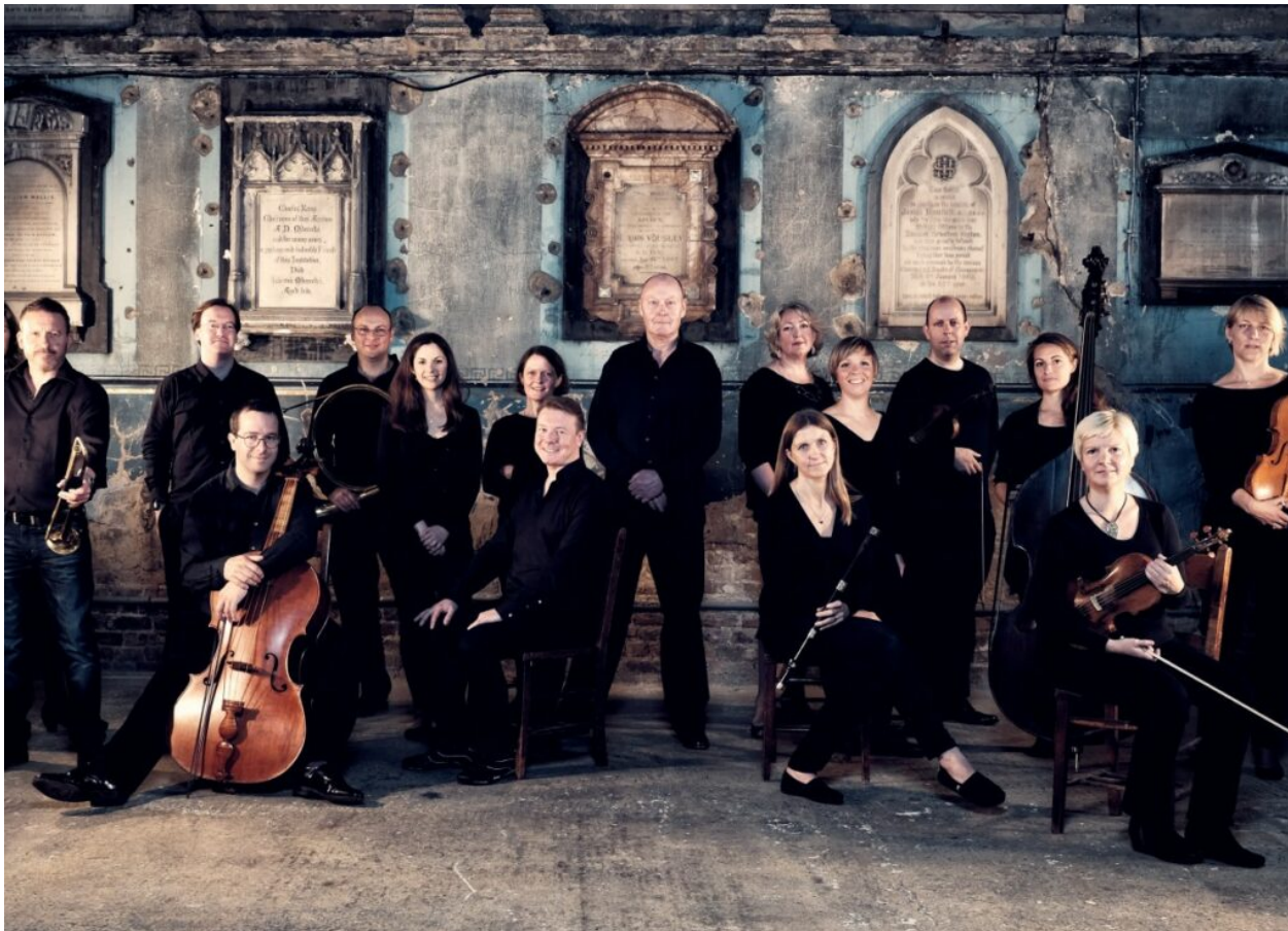
“King Arthur” par le Gabrieli Consort le 09 juillet place de l’Horloge à Ménerbes