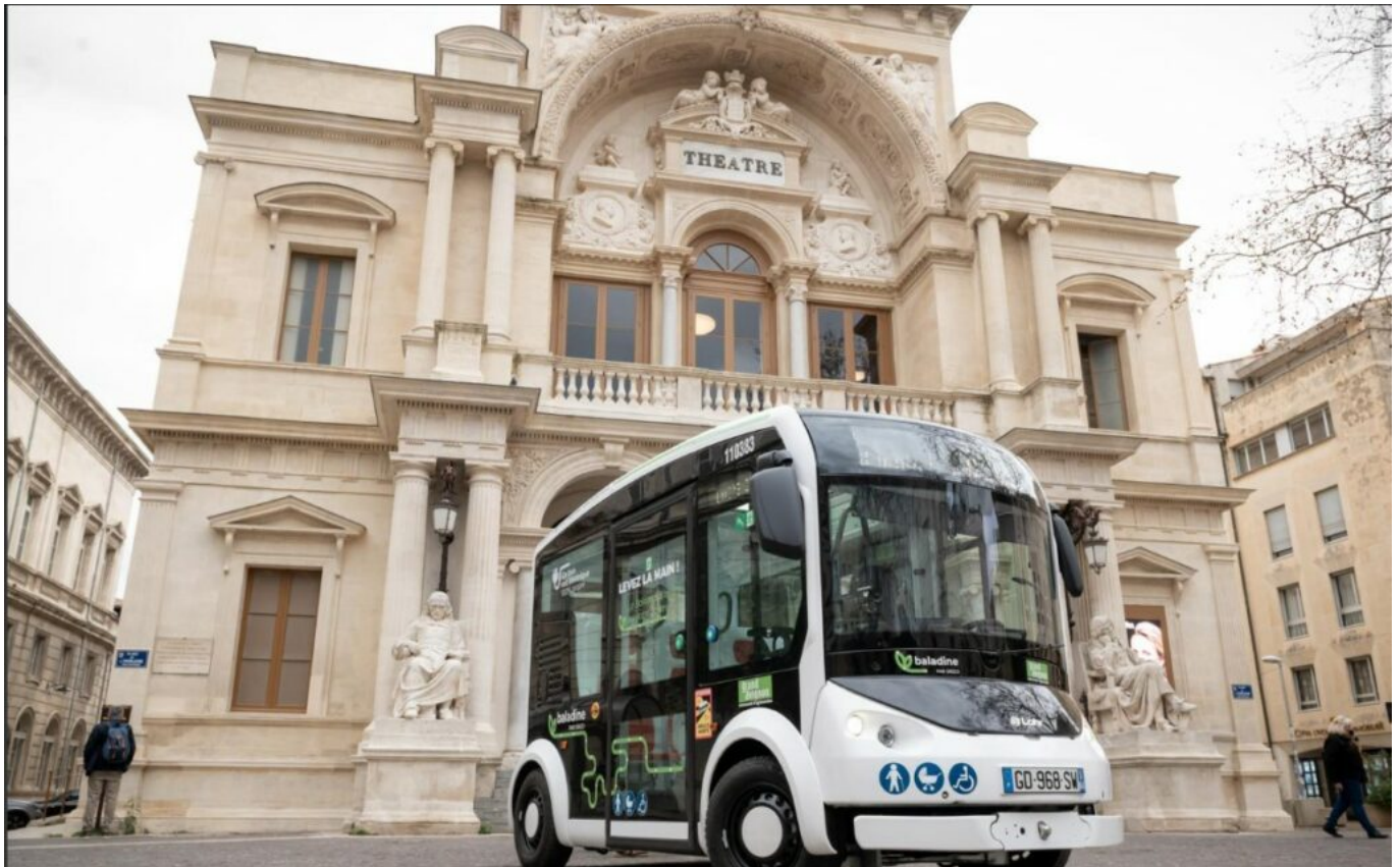
La baladine est gratuite depuis Juillet